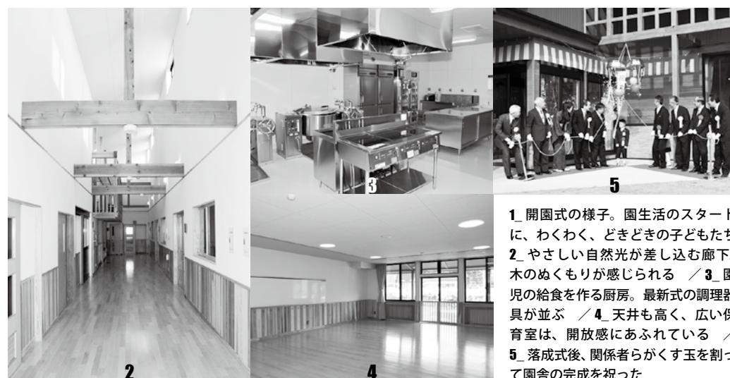
1_開園式の様子。園生活のスタートに、わくわく、ときどきの子どもたち 2_やさしい自然光が差し込む廊下。木のぬくもりが感じられる / 3_園児の給食を作る厨房。最新式の調理器具が並ぶ / 4_天井も高く、広い保育室は、開放感にあふれている / 5_落成式後、関係者らがくす玉を割って園舎の完成を祝った

▼問い合わせ先 会津保健福祉事務所 衛生推進課食品衛生チーム (29) 5516