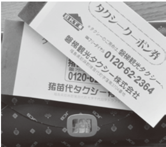
返納により交付される

答 65歳以上の高齢者の方が交通安全の為に自主的に返納した場合に、上限が3万円、バス・タクシー回数券・全国共通商品券のなかから、ご本人が選択できる。