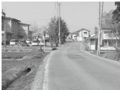
早期拡幅が望まれる千里小前

答 完成している打越地区から町道堅田五百苅線にかけて、千里小前を含めた千代田地区の300メートル幅員14メートルとして整備するための業務委託。