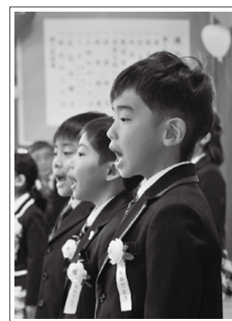
【撮影日】 3月25日 【撮影場所】 猪苗代保育所