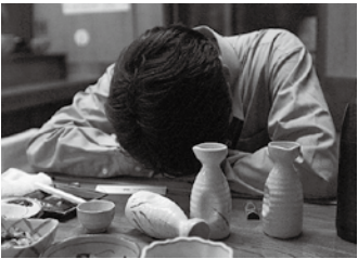
深酒しないように気をつけましょう