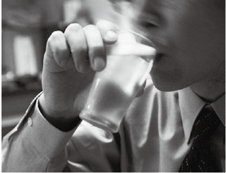
節度ある飲酒を心がけましょう

猪苗代町にもようやくやく春がやってきました。飲送迎会やお花見など、お酒を飲む機会が増えるこの時期：ついつい飲み過ぎてしまうこともあるのではないのでしょうか。「酒は百薬の長」と言われ、適量のお酒は、胃腸を適度に刺激し、食欲を増進させたり、善玉コレステロールを増加させ動脈硬化を防いだりするなどの効果があります。しかし、お酒の飲み過ぎは、がん、肝臓病、膵臓病、糖尿病、痛風、さらには認知症やうつなど、様々な病気を引き起こす危険性があります。そのため、節度ある適度な飲酒を心がけたいものです。