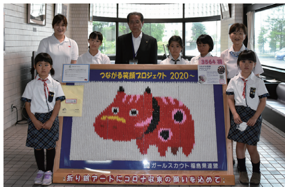
展示セレモニーに参加したガールスカウトの皆さん