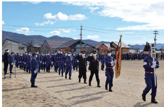
分列行進をする団員ら