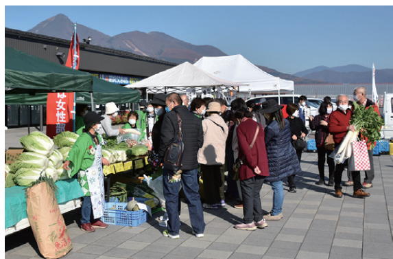
町内産の農産物が並ぶ物産展

農産物物産展には、町内産のハクサイやダイコン、キャベツなどのほか、ブランドそば粉「いなわしろ天の香」の手打ち生そばが販売され、多くの買い物客でにぎわいました。