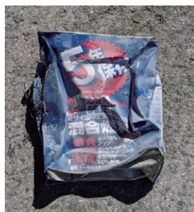
火災事故の原因となったオイル缶

ご家庭に配布している「ごみリサイクルカレンダー」をご確認いただき、ごみの出し方と分別にご協力をお願いします。