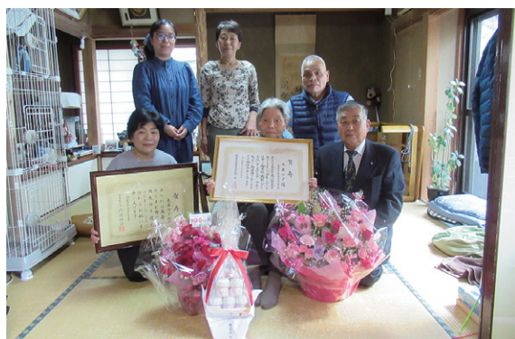
賀寿などを受けたサダさん(前列右から 2 人目)

土屋さんに長寿の秘訣を伺うと、「遠慮しないこと。よく食べる」と話してくれました。土屋さん、いつまでもお元気にお過ごしください。