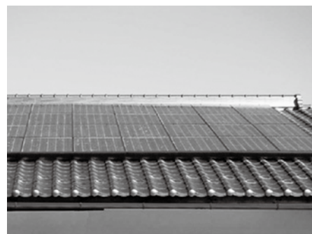
住宅の屋根に設置された太陽光発電パネル

町では、地球温暖化対策の観点から、新エネルギーの導入と促進を図り、自然と共生するまちづくりの推進、循環型社会の構築を目指しています。