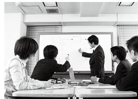
あなたの力、町づくりに生かしてみませんか