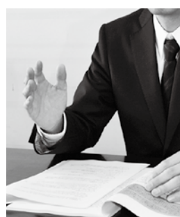
秘密は厳守します。気軽に相談してください

町では、次の日程で人権擁護委員と行政相談委員の合同相談会を開催します。人権問題や法律についてこの機会にぜひご相談ください。