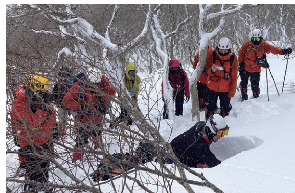
弱層テスト(雪崩が起きるかどうかの確認)の訓練をする参加者

訓練には、同協議会の会員ら約20人が参加。スノーシューをつけた歩行訓練や遭難者が雪に埋まったことを想定した捜索訓練などを行いました。参加者は、遭難救助に必要な技術や知識の向上に向けて訓練に取り組みました。