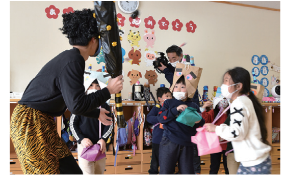
青鬼に向かって豆まきをする子どもたち

ひまわりこども園では2月3日の節分の日に、同園で豆まき会を開きました。 子どもたちは、節分の由来について学んだ後、元気な声で豆まきの歌を歌い、園内各所で豆まきをしました。教室に戻ると、大きな太鼓の音とともに鬼に扮した職員が登場。怖がりながらも古新聞で作った手作りの豆を投げ、悪い鬼を追い払いました。 当日の給食には、鬼の嫌いな豆やイワシを使った節分料理を取り入れ、遊びや食事を通して、日本の伝統行事に触れました。