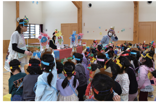
手作りの鬼に向かって豆まきをする子どもたち