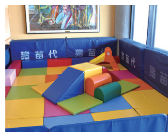
カメリーナの屋内遊び場

▼問い合わせ先 保健福祉課 社会福祉係 ☎(62) 2115 教育総務課 教育施設整備係 ☎(62) 5677