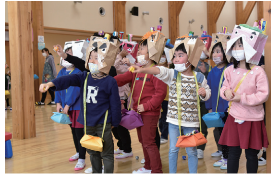
図書コーナーで元気に豆まきをする子どもたち

ひまわりこども園では2月3日の節分の日に、同園で豆まき会を開きました。 子どもたちは、節分の由来について学んだ後、元気な声で豆まきの歌を歌い、園内各所で豆まきをしました。教室に戻ると、大きな太鼓の音とともに鬼に扮した職員が登場。怖がりながらも古新聞で作った手作りの豆を投げ、悪い鬼を追い払いました。 当日の給食には、鬼の嫌いな豆やイワシを使った節分料理を取り入れ、遊びや食事を通して、日本の伝統行事に触れました。