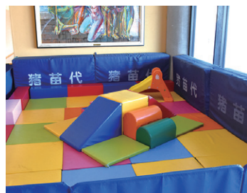
カメリーナの屋内遊び場