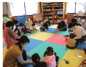
児童館の屋内遊び場

また、閉校となった学校は、現在、文部科学省の『未来につなごう「みんなの廃校」プロジェクト』を活用し広く情報発信しているところであり、今後活用方法を検討してまいります。