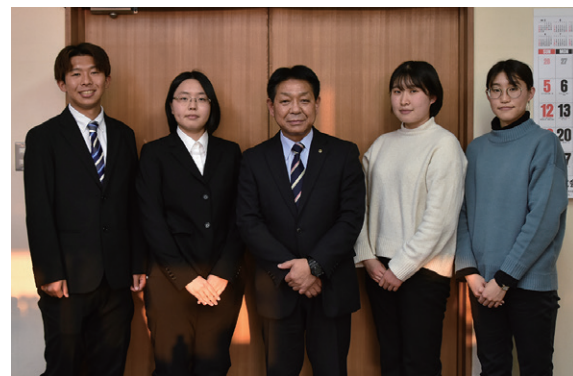
ボランティア事業に参加した学生ら

東京学芸大学の学生4人は2月27日から3月3日まで、翁島小学校と緑小学校で教育支援ボランティア活動に取り組みました。町と同大学は、地域連携協定の一環として、平成28年度から「学生による教育支援ボランティア事業」を実施しています。4人の学生は、学習のサポートや行事の手伝い、休み時間には一緒に遊ぶなどして児童と触れ合い、熱心に活動に取り組みました。