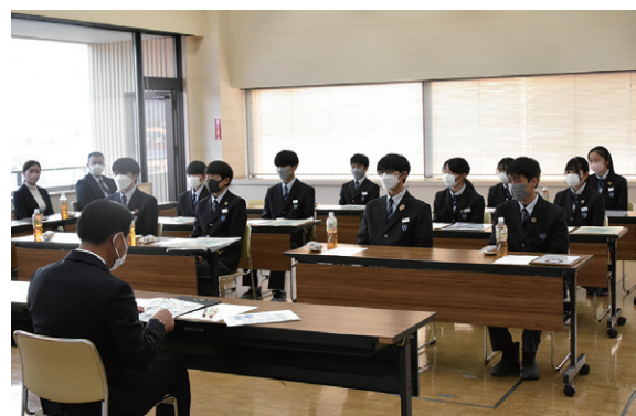
前後町長に活動を報告する生徒ら