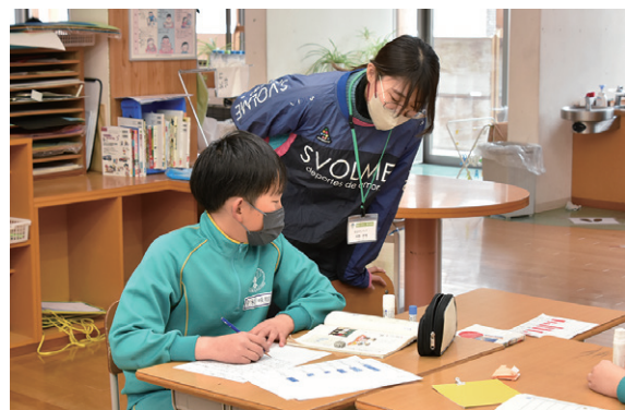
緑小4年生の国語の授業で児童の補助を行う学生(右)