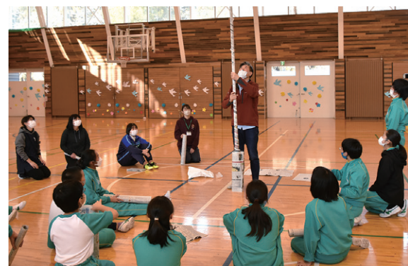
同大学の先生による図工の授業(緑小)