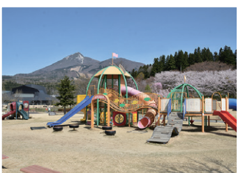
使用可能となった現在の亀ヶ城公園遊具

また、現在、使用禁止しているその他の遊具については、随時、使用可能となるよう補修を行い、利用可能としていきます。老朽化が激しい遊具については、令和6年度以降に全面的な改修を行う予定でありますので、ご理解とご協力をお願いします。