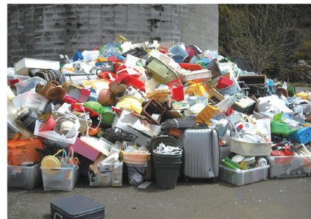
旧衛生センターに集められた商品プラ。これらは全てリサイクルされます