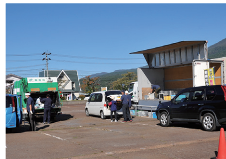
小型家電と古着回収の様子

次のページの回収品目一覧のとおりです。なお、ぬいぐるみやテレビ、エアコンなどは回収