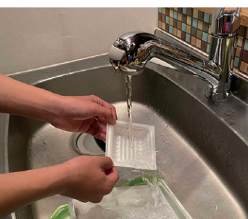
水洗いで汚れを落とす

ほとんどの汚れは、水やお湯で軽く洗えば大部分は取れます。また、食器等を洗ったお湯や水を使うことで、節水・省エネにつながります。 洗ってもどうしても汚れが取れない場合は、「燃やせるごみ」に出してください。