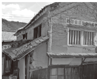
近隣への被害が懸念される 危険空き家

【総務課長】 平成28年の調査 で、空き家が440件、 うち危険空き家が86件。 近隣住民からの相談が あった場合、所有者に 通知をし危険度の軽減、 解消に努めている。