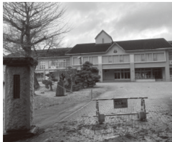
利活用が望まれる旧東中学校

【教育総務課長】 文部科学省 や町のホームページな どで意見やアイデアを 募集した。東京都から 4件、郡山から2件、 町内から1件問い合わせ があり、協議を進め ていく。