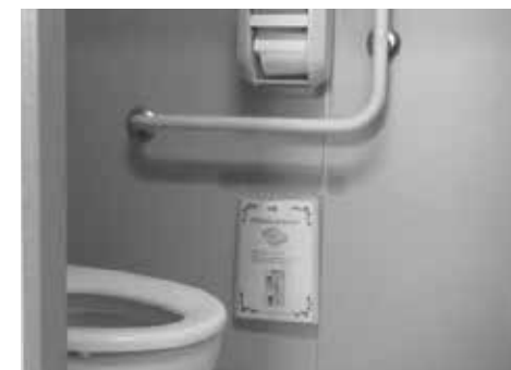
他県の学校の設置事例

【質問】学校のトイレに、トイレットペーパーと同じように生理用品を設置すべきでは。 【町長】町としては、今後前向きに検討して、設置することとする。