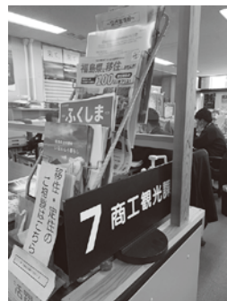
移住・定住の相談窓口

【質問】統合中学校となり、身近にあった学校がなくなってしまったことで、町民の方の学校への思いが、希薄になってきているのではとの声がある。対策が必要では。 【教育総務課長】生徒が存在しない行政区などもあるので、学校や町広報などにより、学校活動の情報幅広く発信し、身近で親しみのある中学校と捉えていただけるように、努力してまいる。 【質問】後援会活動（会費徴収）について、区費計上などによる会費徴収の提案がなされた。これは会の運営が何らかの手助けを必要とする状況と判断するが。 【教育総務課長】町では後援会の活動内容に何らかの支援が出来ればと、検討してみたい。