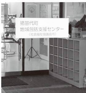
相談窓口 地域包括支援センター

【企画財務課長】ヤード確保への課題もあり慎重に検討していく必要がある。現在まで実現にいたっていない。