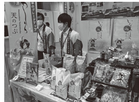
首都圏での米の商談会

【質問】移住・定住については現在どのような取り組みをしているか。 【商工観光課長】町のホームページに掲載するなど、ワンストップ窓口を商工観光課に設置し対応している。 【質問】希望者が求める情報の提供がなされているか。 【商工観光課長】紹介可能な物件等の紹介や自然環境等について提供しているが、福祉や子育てなどの詳細については、それぞれの所管課におつなぎしている。 【質問】空き家への移住についても窓口が一本化しているのか。 【総務課長】空き家対策については総務課で防災防犯など、建設課はリフォーム対策、景観などで、移住定住に関しては商工観光課が所管しており、それぞれの課で対応している。