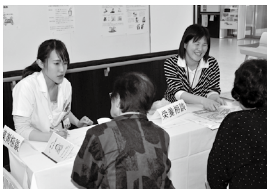
薬剤指導や栄養指導を受ける来院者ら