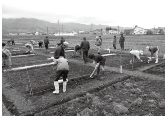
野菜作りの講習を受ける受講者ら

町地域農業活性化センター(アグリいな)の町民農園は5月13日、開園を迎えました。この農園は、農作物の栽培を通して、農業に対する理解を深めてもらおうと、町農林課が開設するもので、24年度は8組の利用者が野菜作りなどを楽しみます。