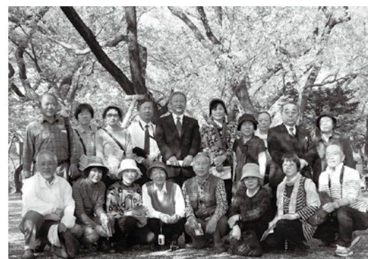
高遠城址公園のタカトオコヒガンザクラの前で記念写真

生誕祭前日の交流会で伊那市長から譲り受けた桜の苗木は5月3日、土津神社春季大祭に続いて執り行われた保科正之公生誕400年記念植樹祭において植樹されました。