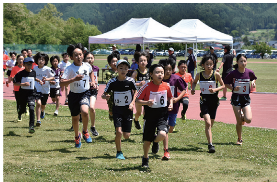
小学 5・6 年男子・女子の部の様子

当日は好天にも恵まれ、参加した選手たちはそれぞれ自己ベストを目指して新緑の中、爽やかな汗を流しました。会場には、ゴールを目指して一生懸命に走る選手を応援するため、多くの人が駆けつけました。