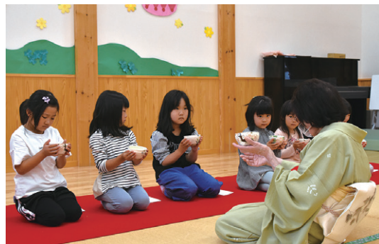
茶道の所作を学ぶ園児

ひまわりこども園では6月22日、同園で茶道教室を開きました。熊倉宗久社中の皆さんが講師を務め、園児に茶道の基本を丁寧に説明しました。 茶道教室にはひまわり組の園児が参加。園児は、あいさつやお辞儀の仕方などの礼儀作法を教わった後、茶せんを使って上手にお茶をたて、茶道の心に触れました。 茶道教室に参加した園児たちは「お茶が苦いです」と感想を話しました。