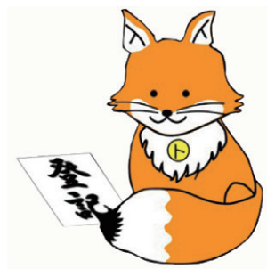
不動産登記推進イメージキャラクター 「トウキツネ」

また、正当な理由がないのに、不動産の相続を知ってから3年以内に相続登記の申請をしないと、10万円以下の過料が科されることがあります。