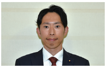
長友 海夢 議員

少子高齢化が猪苗代町の一番の問題だと思っている。若い人たちがここに住んでみたい、ここで子育てしたい、商売したいと思える魅力あるまちにしていけるように活動していきたい。