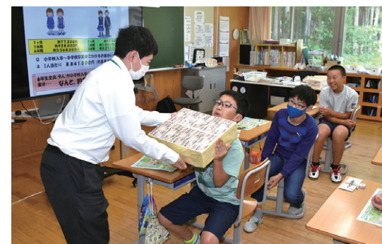
レプリカの1億円の重さに驚く児童