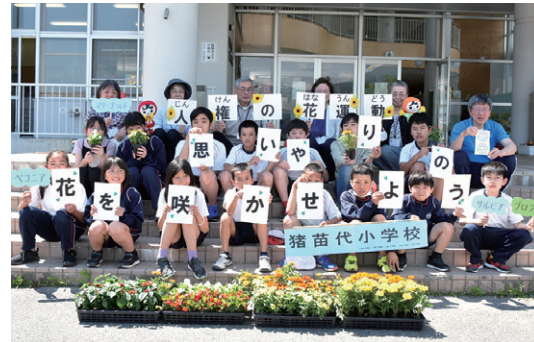
花の苗の贈呈を受けた猪苗代小の児童ら