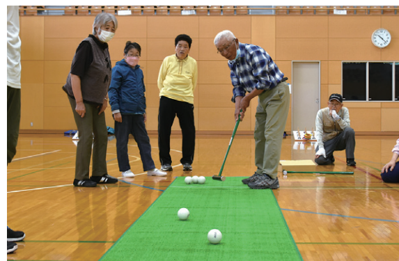
スカットボール競技で穴に向かってボールを打つ参加者

町高齢者スポーツ大会は 6 月 23 日、町総合体育館で開かれ、町内 6 地区から 46 人が参加しました。競技は、得点のついた穴に向かってボールを打ち点数を競う「スカットボール」などの個人種目と紅組、白組に分かれて競う「玉入れ」やラグビーボールを棒で転がして進む「ブタ追い競走」の団体種目で争われました。参加者は、真剣に競技に取り組みながら、スポーツを通じて健康増進を図りました。