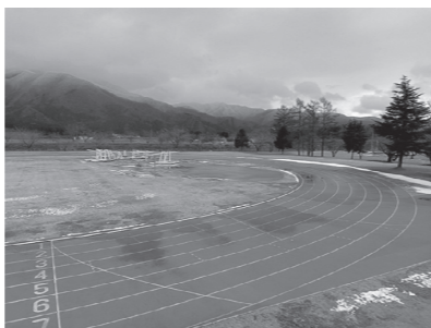
改修工事が行われる 町運動公園陸上競技場

契約金額5390万円、工期は令和5年10月31日。 令和5年11月3日に満了となる第3種公認について、公認を更新するため。