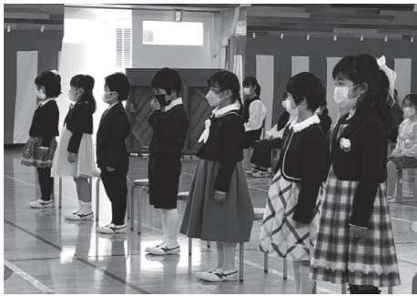
最後となった緑小入学式