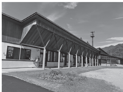
保育料無償化が期待される