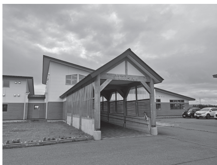
今後の取組が期待されるこども園

【企画財務課長】路線バスは委託路線の前年度欠損額が約4500万円となっており、現在の運行本数を確保すると、費用についてはこれ以上増えることが予想される。デマンドタクシーは、町内全域を対象とした場合、約2000万円程度の経費が必要と試算される。観光二次交通については、これからの協議を踏まえ検討したい。