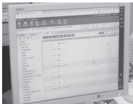
建設課が使用する設計積算システム

なお、予定価格は予定価格設定者が金額の記入及び封印を行い、担当課長が入札または見積合わせ実施日まで厳重に保管し、入札等の当日に会場で開封を行っている。