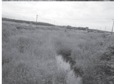
観音寺川上流と下流の現況