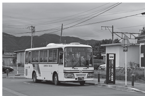
事業廃止となる路線バス

【企画財務課長】磐梯東都バス株式会社からは、現在、事業譲渡について協議中である旨の報告を受けたところである。引き続き、バス会社と情報を共有し、対応について協議しており、現時点では、基本的には新たな事業者を探してもらい、見通しが立つまで運行を継続することを要望している。