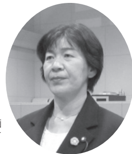
質問者の動画 が見られます