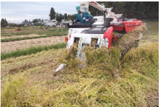
直播栽培の収穫作業