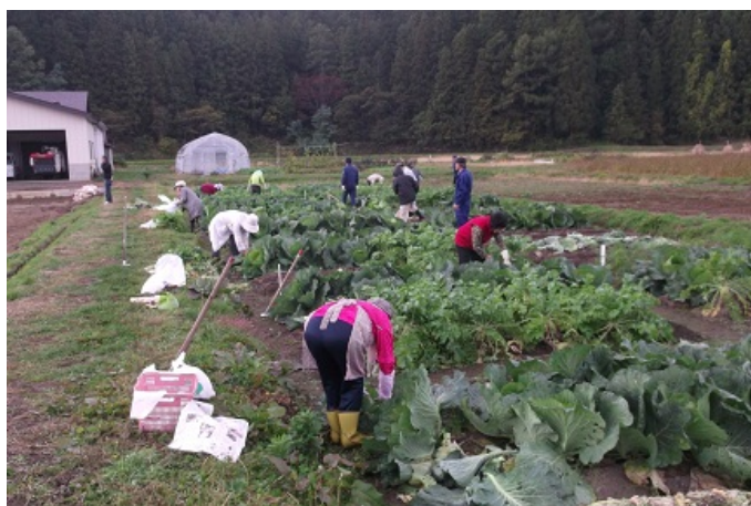
キャベツの収穫をする受講者