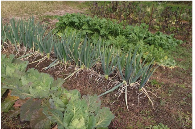
町民農園で作付した農作物

今年度からスタートした町民農園の利用者は、ご家族や友人の方などと一緒に家庭菜園を楽しまれ、また利用者同士で作った野菜を交換されたり、大変楽しんで頂けたようです。