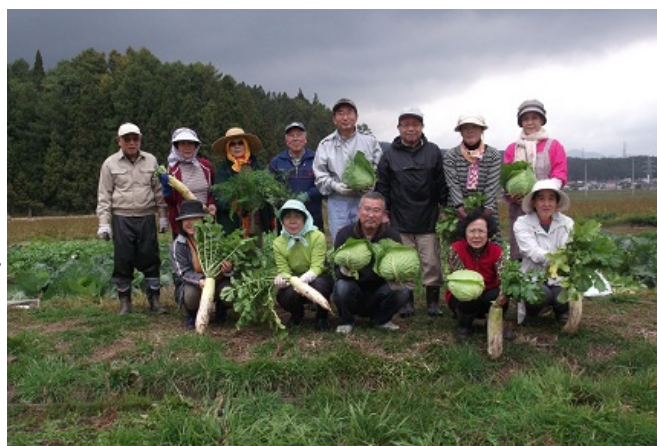
収穫を喜び皆で記念撮影

作付した野菜は収穫期を迎えており、大きく成長した野菜を収穫し、収穫量の多さに大変喜ばれていました。今年度の野菜作り講習会は今回で終了となりますが、この経験を今後の野菜作りに生かしていただければと思います。