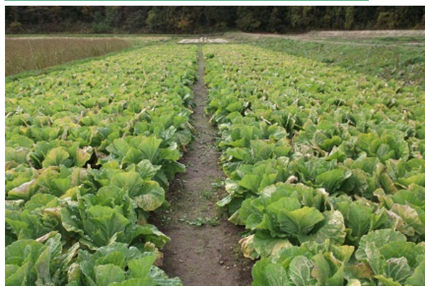
大きく成長したハクサイ

今年度は夏の高温の影響で、優良堆肥施肥試験のハクサイに「軟腐病」が発生しましたが、無事収穫することができました。収穫したハクサイは、「猪苗代新そば祭り」で販売しました。