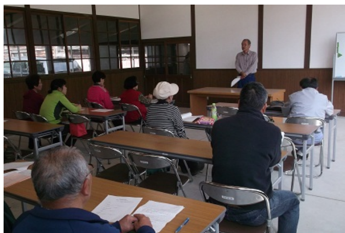
講義を受ける受講者

講習会では、作付したキャベツ・ダイコン・ニンジンの施肥や防除についても振り返り、栽培上の反省点や改善点などの講義を行いました。