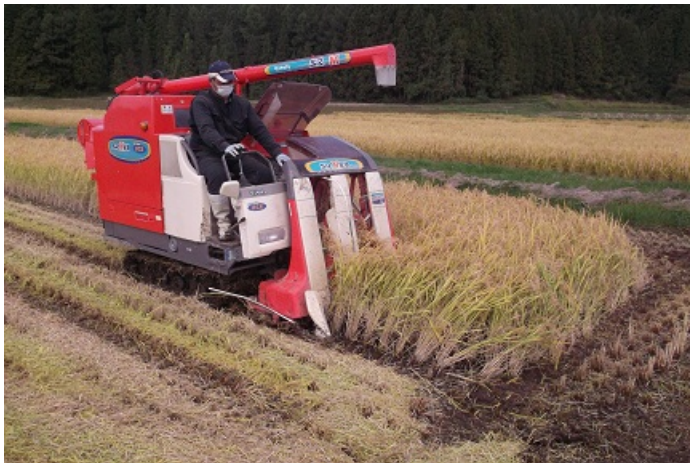
コンバインでの稲刈り

9月26日からバインダーやコンバインで稲刈りを行い、10月22日に全ての刈取り作業が終了し、現在収量調査中です。調査結果は次号以降の「アグリいな」でお知らせします。