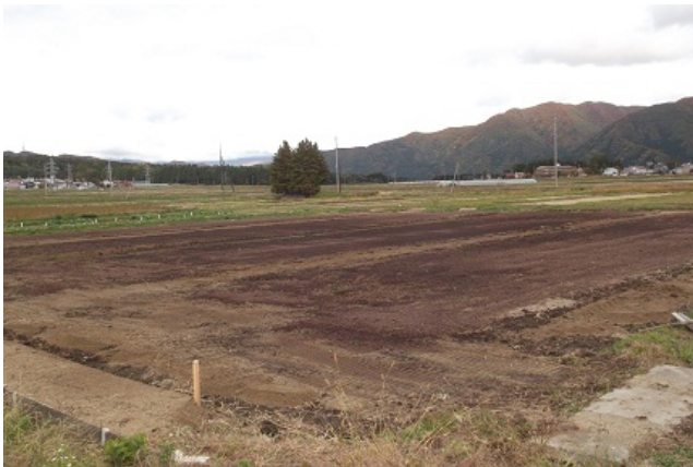
来年の町民農園予定地

現在、アグリいなでは来年度に向けて町民農園の整備を行っています。今年度は8区画利用いただきましたが、来年度は28区画に区画数を増やし募集する予定です。詳細につきましては次号以降の「アグリいな」でお知らせします。