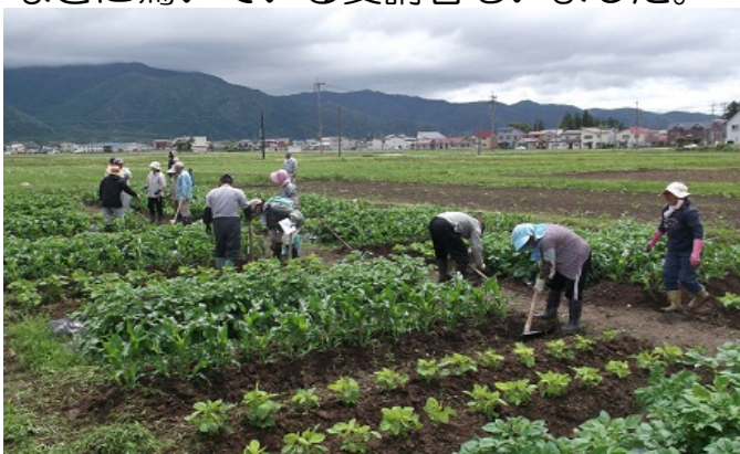
作業の講習を受ける受講者

ほ場における作業では、各受講者が量った肥料の追肥、中耕、土寄せ、除草を行いました。受講された方は作物の生育の早さに驚かれ、収穫を楽しみにしていました。7月下旬にはジャガイモの収穫ができそうです。