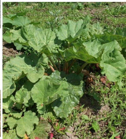
ルバーブ (茎を煮詰めて、ジャムにします)