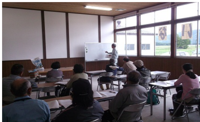
講習を聞く受講者

講義終了後には、各受講者が実際にほ場に散布する肥料を量りました。量の少なさに驚いている受講者もありました。