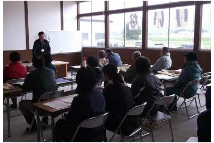
講義を聞く受講者

講習会では、「野菜作りのポイント」や土づくり、手入れなどの栽培方法の説明を行いました。