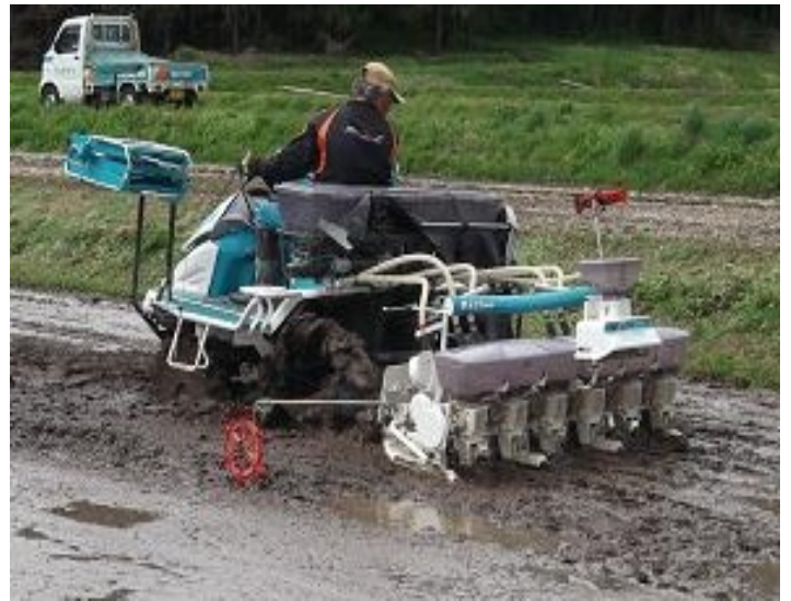
直播栽培試験の播種

播種後約10日で発芽が確認されました。今後の生育状況については今後の「アグリいな」でお知らせします。