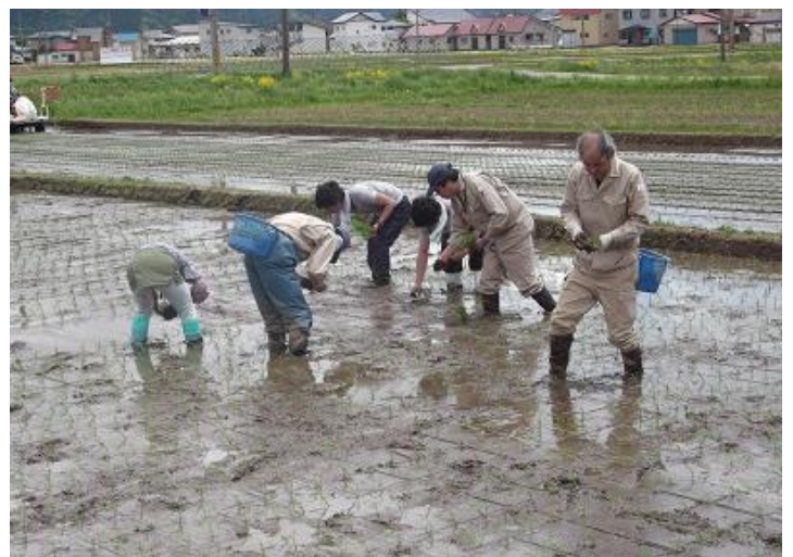
県奨励品種決定調査ほ場の手植え