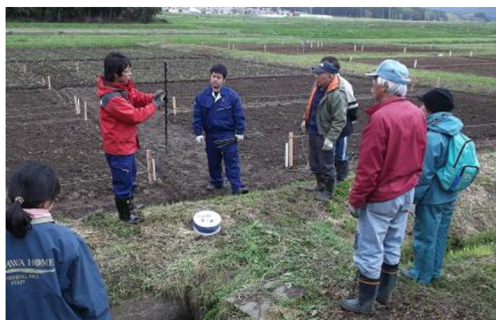
電気柵設置の説明を聞く参加者

町民農園使用者の方からは、「土の作り方、畝の作り方、肥料の与え方など様々な畑に関する知識を学びつつ作業出来るので、とても勉強になります。」との声がありました。