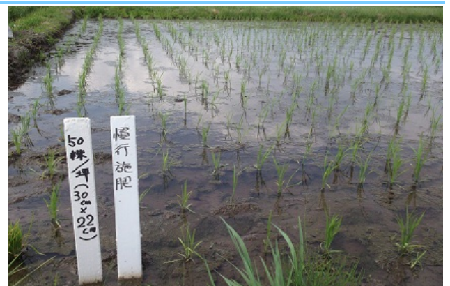
疎植栽培試験 坪50株

「アグリいな」では坪 50 株（30cm×22cm）、坪 37 株（30cm×30cm）を栽培しています。今後の生育状況については、今後の「アグリいな」でお知らせします。