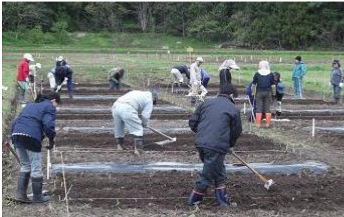
作業の講習を受ける受講者

作業では、うねの作り方やくわの使い方、マルチング、種まきを講師の指導のもと行いました。受講された方は一生懸命作業に取り組み綺麗に仕上げる事が出来ました。