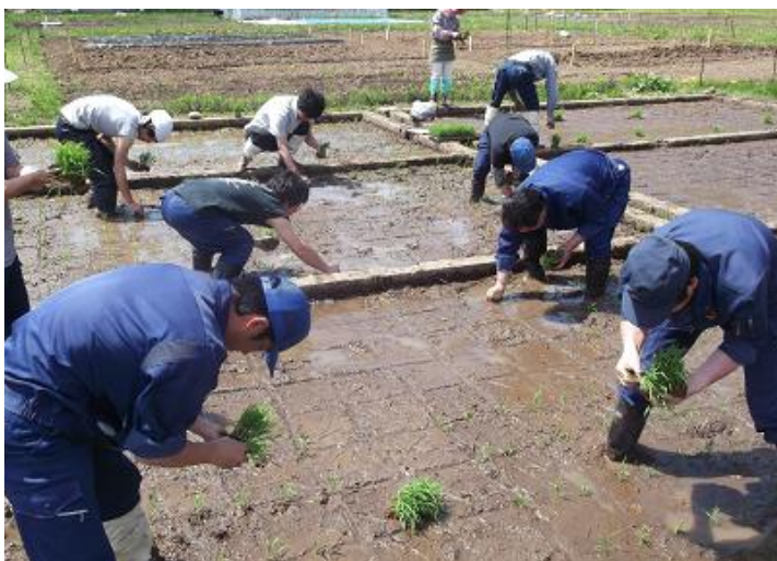
三要素試験ほ場の手植え