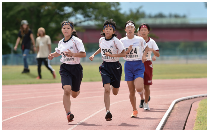
ラスト1周で先頭をうかがう各選手(6年女子800m)

児童は、自己ベストを目指して一生懸命、競技に取り組みました。主な結果は下記のとおりです(敬称略)。