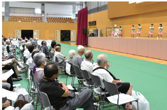
ダンスを披露するさくらこども園の園児