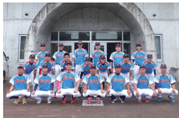
2年連続ベスト16まで勝ち抜いた選手の皆さん