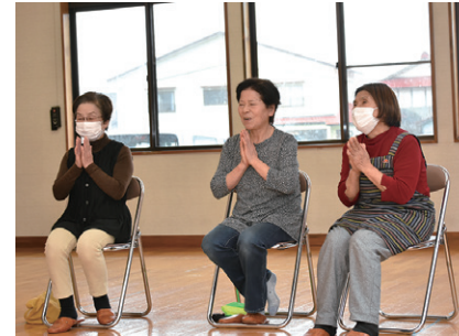
1投ごとに拍手が送られていました