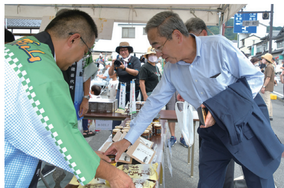
本町の特産品を購入する伊那市の白鳥孝市長(右)