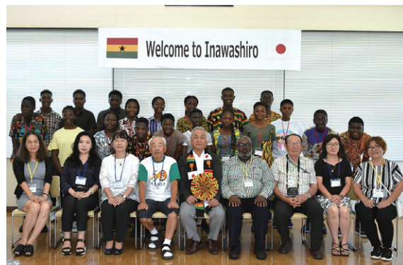
二瓶町長を表敬訪問したガーナの高校生ら