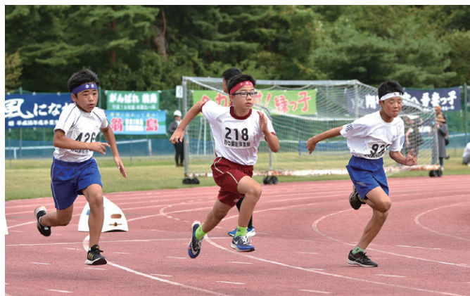
ゴールに向かって力走(6年男子100m)