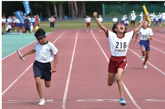
接戦となった男子4×100mリレー