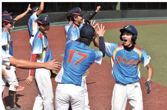
得点に喜ぶ本町チームの選手たち

本町チームは9月10日に1回戦で国見町と対戦し、7対0で5回コールド勝ち。2回戦は、23日に只見町と対戦し、1対0で勝利。翌日の3回戦は、昨年敗れた矢吹町と対戦し、8回タイブレークの末、1対2で惜しくも敗れました。