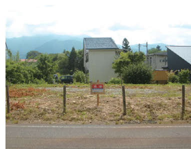
売却する古城町地区の土地