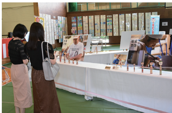
工人の写真や作品を紹介するコーナー

中ノ沢温泉街の旅館ではこけしを販売。中ノ沢体育館では、工人の作品が展示されたほか、絵付け体験や街歩きでスタンプを集めて景品が当たる抽選会などが行われ、多くの人で賑わいました。