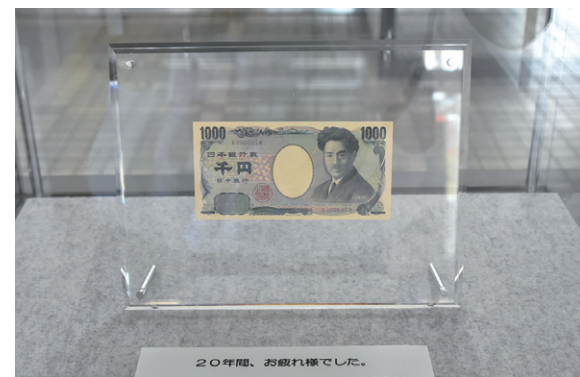
町役場1階会計室前に展示した千円札5番券

2004(平成16)年11月1日に野口英世博士の肖像を採用した新千円札が発行されてから、来年で20年を迎えるため、町役場1階会計室前に千円札5番券(A000005A)を10月から展示しました。2024(令和6)年の上期から千円札は、北里柴三郎博士の肖像に新しく変わります。町では、これからも野口英世博士の偉業を顕彰し、不屈の意思と深い人間愛の精神を後世に伝えていきます。