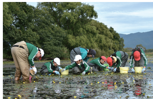
胴長を着てアサザの種を取る翁島小の児童

猪苗代湖の自然を守る会の鬼多見賢代表が協力し、アサザの種の取り方を児童に説明。取った種は学校でまいて、苗に育てます。翌年度に6年生となる児童たちが、その苗を猪苗代湖に移植し、水質の改善につなげます。