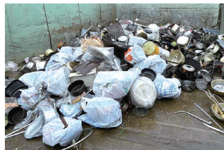
▲袋に入れた状態で出された金属くず