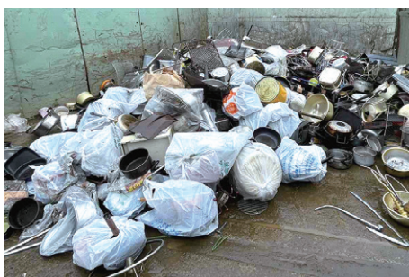
▲袋に入れた状態で出された金属くず