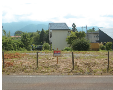
売却する古城町地区の土地