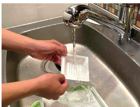
水洗いで汚れを落としてください

汚れているものは、リサイクルができませんので、汚れを取ってから出すようにしてください。ほとんどの汚れは、水やお湯で軽く洗えば大部分は取れます。また、食器等を洗ったお湯や水を使うことで、節水・省エネにつながります。汚れの目安は、目で見て汚れがわからない程度で、洗つてもどうしても汚れが取れない場合は、「燃やせるごみ」に出してください。