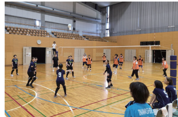
熱戦を繰り広げた家庭バレーボール

ソフトボールには11チーム約190人が、家庭バレーボールには6チーム約80人が参加し、選手たちはスポーツを通じて親睦を深めながら爽やかな汗を流しました。熱戦の末、ソフトボールは月輪Westと扇田チームが優勝。家庭バレーボールは扇田と猪苗代Bチームが優勝しました。