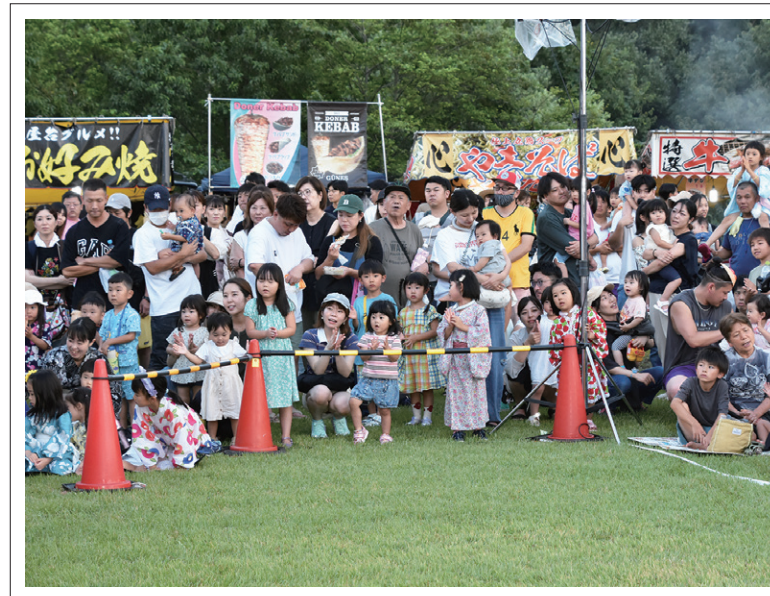
アニメキャラクターショーを楽しむ家族ら