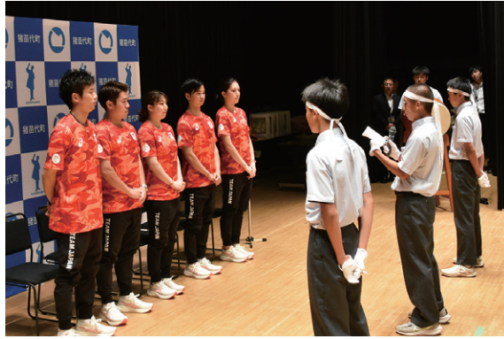
7月4日に学びいなかで開かれた壮行会で猪苗代中の生徒(右)からエールを送られた選手(左)たち