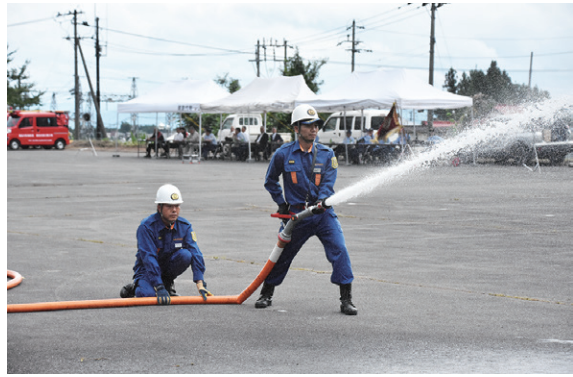
火点に向かって放水する団員