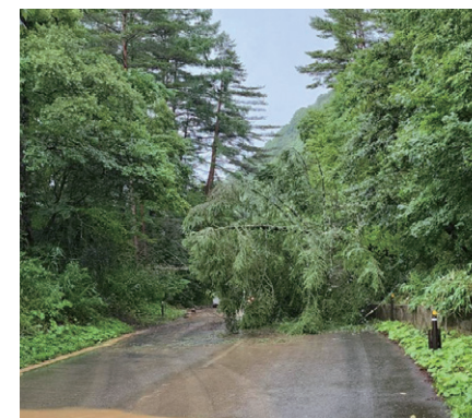
土砂崩れによる倒木があった国道459号

災害発生時の危険度に応じて町から避難情報等とともに警戒レベルが出されます。警戒レベルの数字が大きくなるほど災害発生時の危険度が高くなります。警戒レベル4「避難指示」が発令されたら、危険な場所から全員避難してください。国や県から発表される土砂災害警戒情報や大雨特別警報などの防災気象情報も参考に、適切な避難行動をとってください。