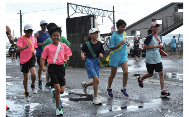
川桁駅前から元気よく走り出す小学生ら

町スポーツ少年団陸上競技部の猪苗代T&Fは8月17日、子どもたちに沼尻軽便鉄道の歴史を知ってもらうとともに、いなわしろ軽便ウォークのPRをしようと沼尻軽便鉄道の線路跡をリレー形式で走りました。小学生ら約20人が参加し、複数のチームに分かれて川桁駅をスタート。終着駅の沼尻駅まで約18kmを走破しました。26回目を迎える同軽便ウォークは10月6日（日）に開催され、9月20日（金）から申し込みが始まります。