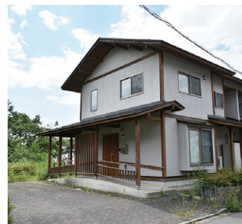
メゾネットタイプ3LDK