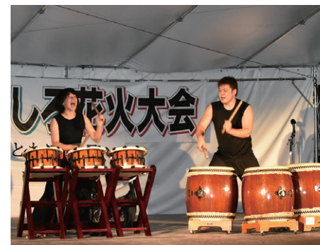
太鼓の演奏で会場を盛り上げた猪苗代太鼓猪駄天

いなわしろ花火大会は8月17日、町運動公園で開かれ、約2500発の花火が夜空を鮮やかに彩りました。当日は一時的に強く雨が降りましたが、会場には出店が立ち並び、大勢の観客でにぎわいました。 今年の花火大会のテーマは「ともに、明日へ」。東日本大震災からの復興と子どもたちの輝く未来に祈りを込め、音楽に合わせて大玉やスターマインの花火が次々に打ち上げられました。大迫力で打ち上げられる花火に会場を訪れた多くの観客からは大きな歓声が上がりました。 花火打ち上げ前には、人気のアニメキャラクターショーや太鼓の演奏が繰り広げられ、訪れた家族連れなどがステイジイベントを楽しみました。