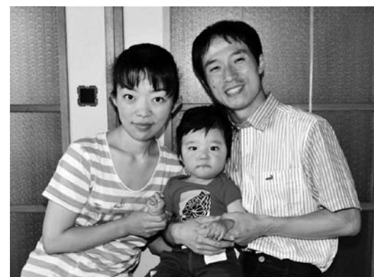
大好きなパパとママと一緒に「ハイ、チーズ」

まだまだ暑さが続きますが、冷たい飲み物、食べ物の取り過ぎに注意しながら、おいしく食べて夏を乗り切りましょう。