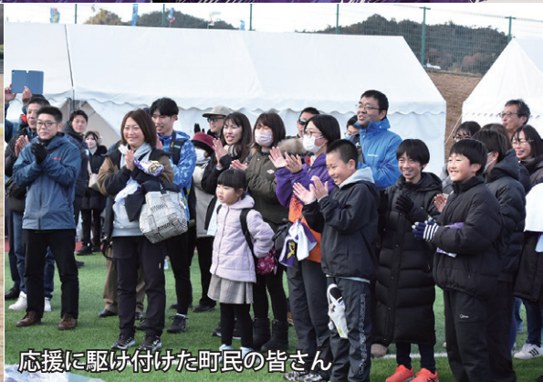
応援に駆け付けた町民の皆さん