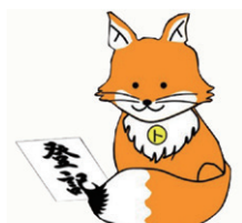
不動産登記推進 イメージキャラクター 「トウキツネ」

出前講座の詳細は、福島地方法務局ホームページの出前講座申込ページをご確認ください。