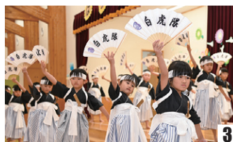
1_ひまわりこども園ちゅうりっぷ組のリズム「千本桜」2_ひまわりこども園たんぽぽ組のリズム「レッツ・ラ・クッキン☆ショータイム」3_ひまわりこども園ひまわり組の剣舞「白虎隊」4_さくらこども園さくら組の剣舞「白虎隊」