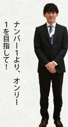
ナンバー1より、オンラインを目指して！