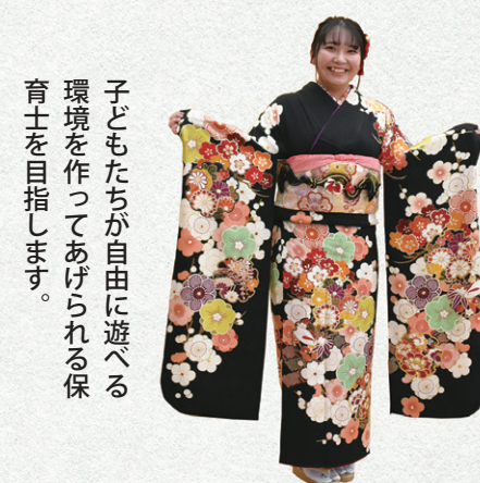
子どもたちが自由に遊べる環境を作ってあげられる保育士を目指します。