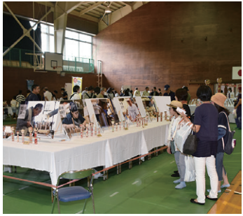
多くの人が訪れた昨年の中ノ沢こけし祭り

中ノ沢こけし祭りへの継続的な支援のほか、中ノ沢こけしプロジェクト実行委員会などの関係団体と連携し、観光パンフレット等への掲載など積極的なPRを行い、工人にもしっかりと光を当て、猪苗代町が誇る伝統文化の継承と人材の育成にも協力していきたいと考えています。