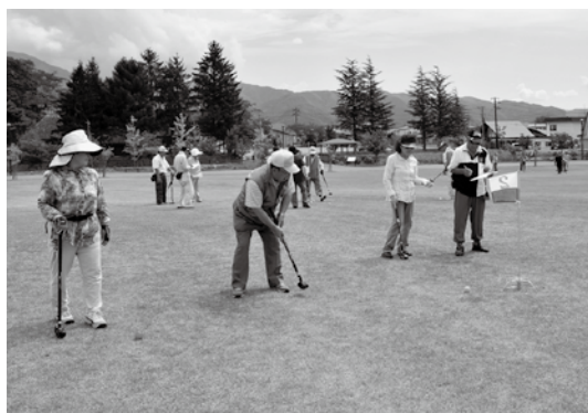
楽しみながらプレーする参加者ら

第6回グラウンドゴルフ町長杯は8月30日、亀ヶ城公園みんなの広場で開催され、選手らが熱戦を繰り広げました。