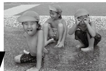
写真上 元気に遊ぶ子どもたち。滑り台が大人気 写真左 「いい湯だなー」とおどける3人。そこは足湯じゃないよ 写真右 最後にみんなで記念撮影しました