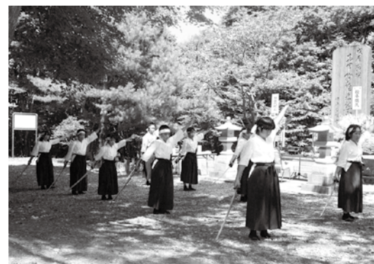
慰霊碑の前で剣舞を奉納する吾妻小の児童

戊辰戦争の激戦地、母成峠(ぼなりとうげ)の戦いで戦死した東軍殉難者の慰霊祭は8月21日、母成慰霊碑前で執り行われ、母成弔霊義会会員や殉難者の子孫など約30人が出席しました。