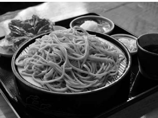
おすすめの天ぶら付もりそば