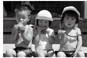
写真上 「みぎー」「ひだりー」先生たちの声でスイカの前にたどり着き、力を込めて棒を振り下ろします 写真下 お待ちかねの時間。大好きなスイカに夢中でかぶりつきます