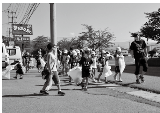
町役場周辺のごみを拾う団員と保護者ら

猪苗代小学校の児童らで構成する猪苗代スポーツ少年団は8月22日、清掃活動を実施しました。