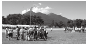
一昨年の町民運動会の様子