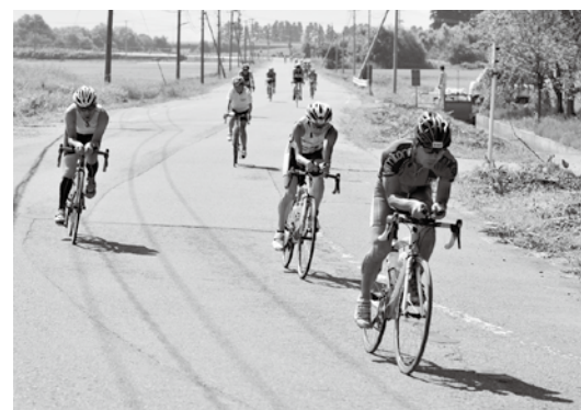
498人の鉄人たちが町内を駆け抜けました

第14回うつくしまトライアスロン in あいづは8月26日、猪苗代湖の天神浜でのスイム(1.5 キロ )、天神浜から会津大までのバイク(40 キロ )、同大周辺を走るラン(10 キロ )の51.5 キロ のコースで開催され、鉄人たちが自らの限界に挑戦しました。