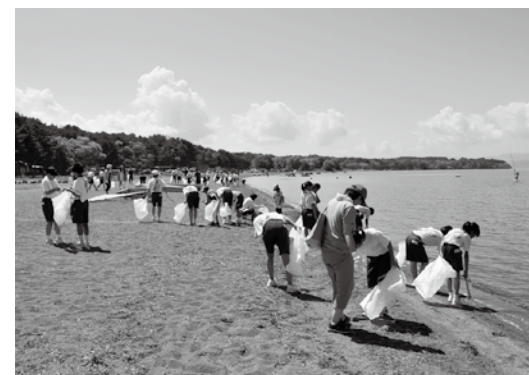
松橋浜のごみを拾う猪苗代中学校の生徒と保護者

町と猪苗代湖環境保全推進連絡会が主催する猪苗代湖岸クリーンアップ作戦は8月5日、天神浜と松橋浜で開かれ、町民194人が湖岸のごみ拾いなどに取り組みました。