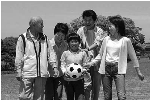
自分と家族のために、健康寿命を延ばしましょう

皆さん、毎年9月が健康増進普及月間ということをご存じですか？この月間は「1に運動 2に食事 3に禁煙 最後はクスリ」健康寿命をのばそう」をスローガンに、皆さんが生活習慣病について正しい知識を持ち、自分の生活習慣を見直し、健康づくりに取り組んでもらうための普及月間です。 日本は世界有数の長寿国ですが、最近では単なる長寿だけでなく、より長く健康で自立した生活ができる期間「健康寿命」を延ばすことが注目されています。