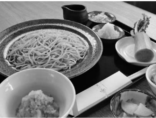
おすすめの会津「葵」蕎麦