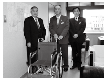
前後町長(左)に車いすを贈呈するJ A あいつの五十嵐代表理事組合長(中央)ら