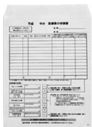
事前に計算をして、 レシートや領収書 を入れて、申告会 場に持参してくだ さい

ください。 例外は、宝くじの当選金です。 一時金ではありますが、非課税な ので申告の必要はありません。