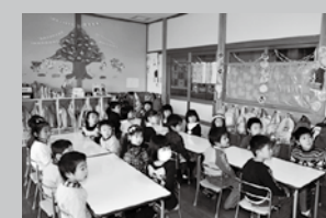
忘れずに接種しましょう

麻しん(はしか)は感染力が非常に強い病気です。感染すると、まれに急性脳炎を起こしたり、死亡したりすることがあります。麻しんの予防接種は、麻しんそのものの発症や重症化を予防することが期待でき、大変重要です。