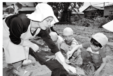
子どもたちへの食育活動も食生活改善推進員の重要な仕事です（6月 吾妻幼稚園）