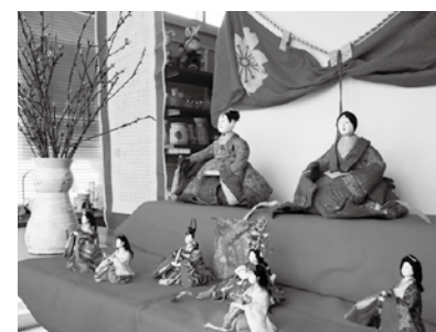
たくさんのおひな様が皆さんの来場をお待ちしています