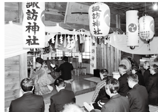
町民が安心して暮らせるように祈願しました

ことし1年の無火災、無災害などを祈願する出初め式は1月6日、町内の諏訪神社で執り行われ、町消防団幹部など約40人が出席し、玉ぐしをささげて町民の安全を祈願しました。