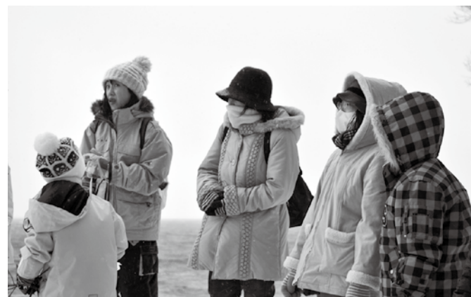
しぶき氷の説明を受ける参加者の皆さん。防寒着でも寒そうです