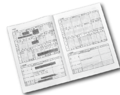
農業の収支内訳書

※事業所得や不動産所得を申告する人は、必ず収支内訳書に記入をした上で持参してください。