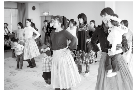
レイやスカートを身に付け、フラダンスに挑戦

※プープーヒヌヒヌは、ハワイ音楽の権威マヒ・ビーマーの祖母で大作曲家のヘレン・デシェイ・ビーマーの作品。ハワイの子どもたちが最初に覚える歌と言われている有名な子守唄です。ちなみにプープーは「貝」、ヒヌヒヌは「輝く」という意味です。