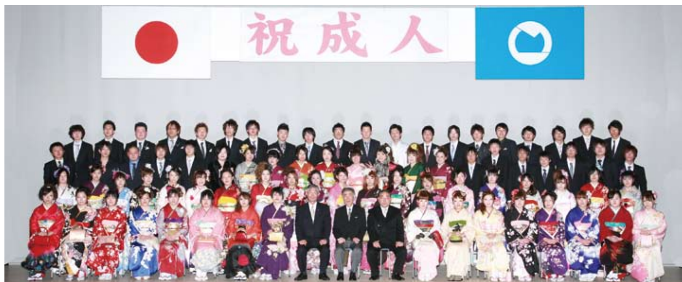
月輪・長瀬・吾妻地区の新成人