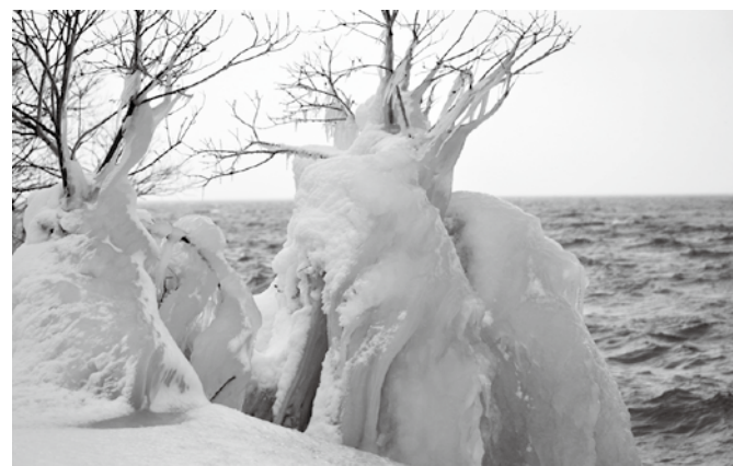
当日のしぶき氷の様子。積雪の影響などで、まだ小さめです