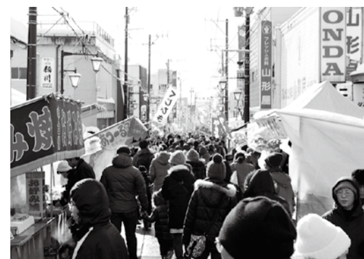
例年よりも多くの買い物客でにぎわった商店街

新春恒例の初市「十三日市」は1月13日、本町・新町通り(中央通り商店街)で開かれました。よく天気が荒れると言われる十三日市ですが、この日は晴天。先着順の福袋に並んだ皆さんも町芸能保存会の太鼓演奏などに聞き入りました。