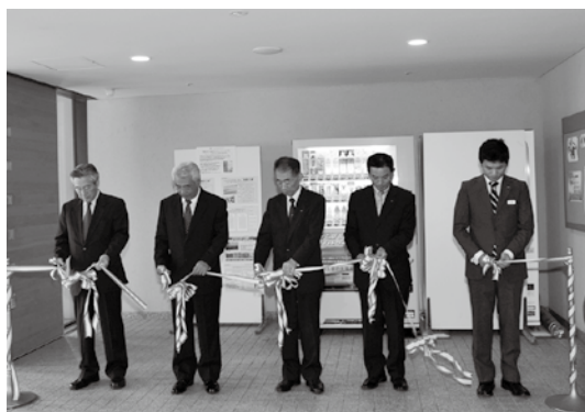
設置式典でのテープカットの様子

福島中央テレビ(FCT)は10月6日、「猪苗代湖をきれいにしよう」キャンペーンの一環として、カメリーナに寄付金型自動販売機を設置しました。これは同キャンペーンの第1号で、サントリーフーズの協力を得て設置。販売機での売り上げ1本につき1円が、猪苗代湖の水環境保全活動への寄付金となり、FCTを通じて活動団体へ寄付されます。