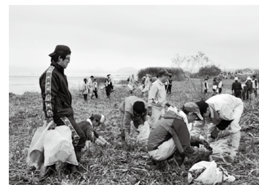
美しさを取り戻そうと、清掃作業に励みました

猪苗代湖北岸のヨシ刈り・ごみ撤去作業(町、県、環境省ほか地元関係団体などの主催)は10月21日、町内堅田の湖岸で実施されました。この大規模清掃は今年で4年目。30の機関・団体から集まった約340人が、北岸から湖にそそぐ小黒川河口の両岸計700㍍で一斉に作業しました。