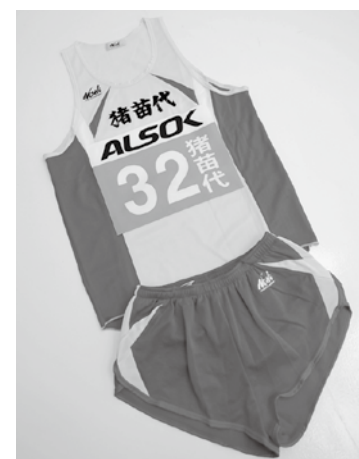
当日は32のゼッケンに熱い声援を