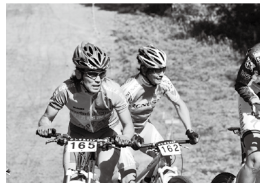
オフロードコースに挑む参加者たち

マウンテンバイクの第4回ジンギスカップIN 磐梯高原は10月3日、磐梯南ヶ丘牧場特設コースで開かれ、329人がオフロードコースに挑みました。白熱した競技終了後は同牧場名物のジンギスカンで交流を深めました。各部門優勝者は次のとおりです。