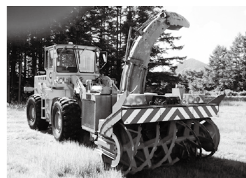
購入希望の人は、必ず現車を確認してください