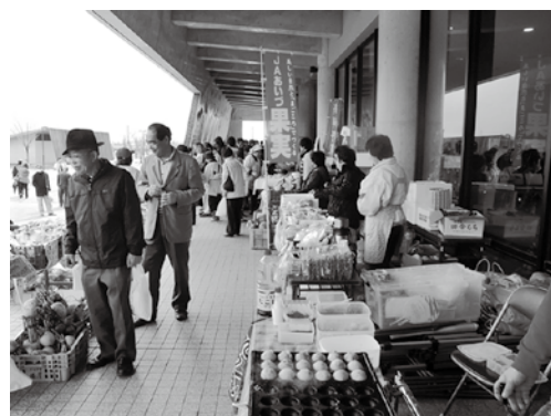
写真は昨年の出店者の様子 屋内ブース(写真左) 屋外ブース(写真右)

第14回猪苗代新そば祭りは11月13、14(土、日)の両日、町総合体育館(カメリーナ)で開催されます。会場内や周辺で特産品などを販売する出店者を募集しますので、希望する人は10月22日(金)までに下記まで申し込んでください。