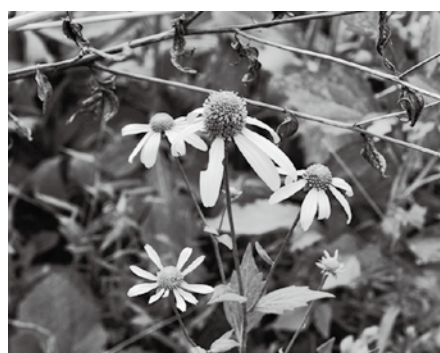
町内某所で発見したオオハンゴンソウ

て日本に持ち込まれましたが、寒さに強く、とても丈夫なことから、今では日本各地で野生化しています。このため、もともとその地域に生えていた植物が減少するなどの悪影響が出ており、国立公園内では駆除をしています。