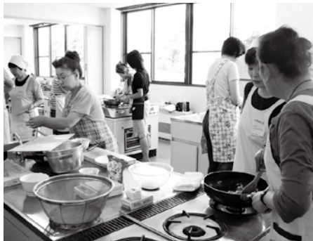
翁島地区の栄養講習会

れに相当する検査を受けている人や病気治療中の人は、町で実施する健診は受けなくてもよいとされてきました。 20年度に導入された特定健康診査では、40歳以上74歳までの人は、治療中の人も含め、全員が自分の加入している保険者が実施する特定健康診査を受けることになっています。社会保険などの被保険者で、まだ健診を受けていない人は、それぞれ加入の保険者に問い合わせの上、受診してください。