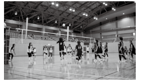
白熱したゲームとなった決勝戦