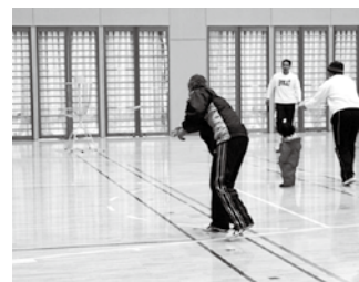
フライングディスクに挑戦