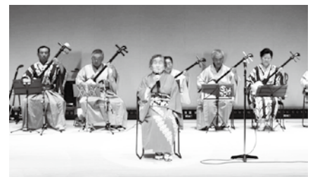
民謡サークルのステージ発表