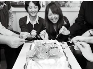
撮影後、おいしくいただきました

▼「600号の記念に、表紙をケーキにしよう」念願が叶い、素晴らしいケーキで表紙を飾ることができました。協力していただいた、デセルカワウチさんに感謝です。（大坂）