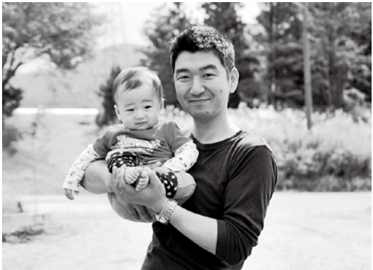
大好きなお外で、パパと一緒にポーズ。

ほど、改善は難しくなります。がんなどの各種検診はもちろん、ぜひ、早いうちに精密検査を受けましょう。 ▼問い合わせ先 保健福祉課 健康づくり業務 ☎(62) 2115