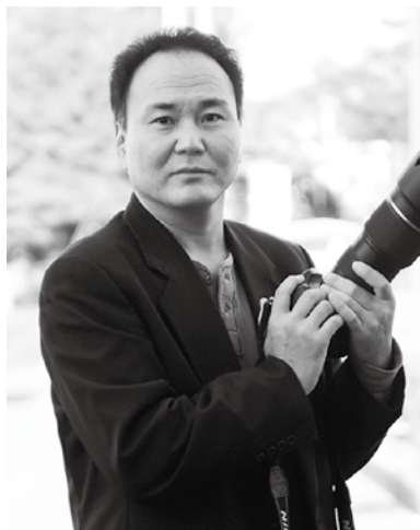
岩手県藤沢町 広報担当