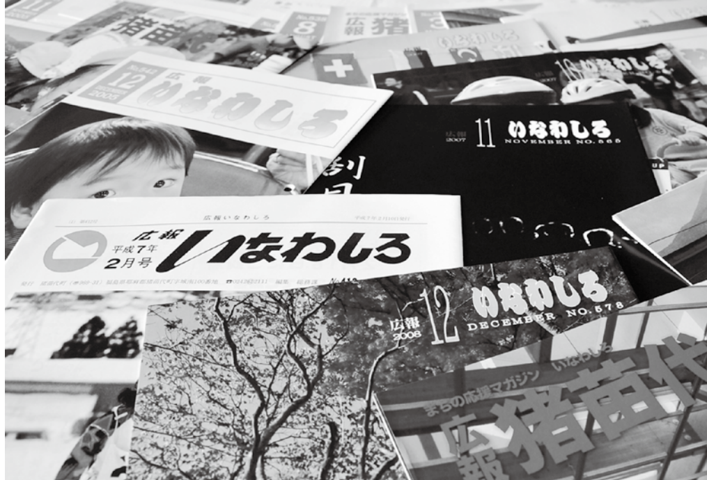
デザインは変わっても大切なものは変わらない広報紙でありたい