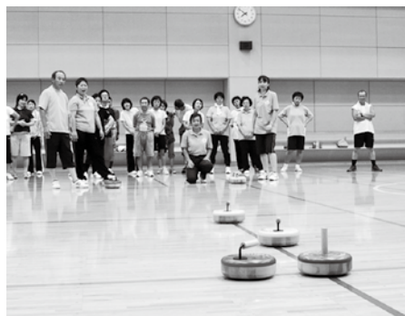
健康運動教室でのカローリング