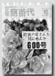
皆さんのお手元へ

契約した運送会社が、各区長のもとに届けます。区長や担当者などが各家庭に配布します。行政区外の人には直接発送します。