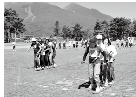
地区対抗のムカデ競走に挑む参加者ら

第30回猪苗代町民大運動会は9月5日、町運動公園陸上競技場で開かれ、町内6地区から参加した約1,300人が親睦を深めました。小・中学生の徒競走や老人クラブ会員による「ゲートインワン」などの年代別競技のほか、地区対抗のムカデ競走、綱引きやリレーなど計17種目で熱戦が繰り広げられました。