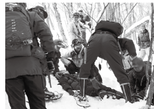
遭難者の状態を確認する参加者ら

猪苗代山岳会、警察署や消防署などで組織する猪苗代地区山岳遭難対策協議会は2月7日、猪苗代スキー場で冬山遭難救助訓練を実施し、万一の事故に備えました。