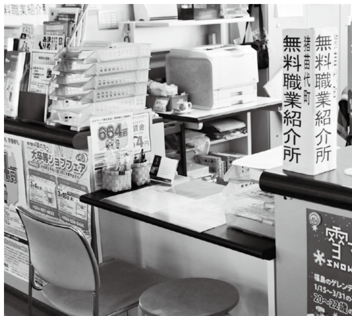
町役場2階の商工観光課に開設している猪苗代町無料職業紹介所