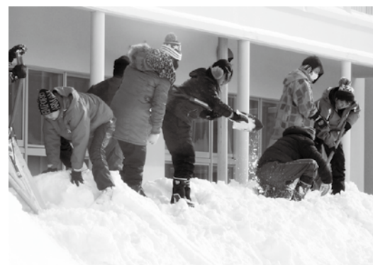
ほとんどの人が雪かきは初めての体験でした

愛知県の少林寺拳法関係者らでつくる「あなたに心届け隊つながろう日本プロジェクト」は9日、本町を訪れ、猪苗代小学校で同校のPTA関係者らと共に除雪作業を行いました。