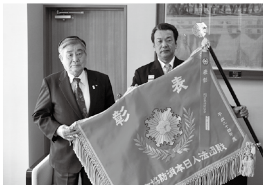
前後町長に受賞を報告した土屋団長(右)