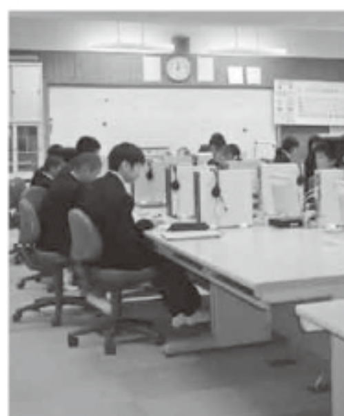
授業に真剣に取り組む猪苗代中学生

【質問】町の平成21年度予算編成の基本方針は、①収納体制を強化し財源を確保する。②コスト意識を持ち削減に努める。③事業は、重点選別を徹底する。④一般財源は、平成21年度までに75%削減を図ることを基本としているが、現時点で歳入歳出の規模をどの程度見込んでいるのか。 【答弁】概算で見積もった額は、61億6000万円程度である。 【質問】各課から積み上がった要求額は。 【答弁】67億4000万円程度である。 【質問】6億円程度、歳出がどう調整するのか。