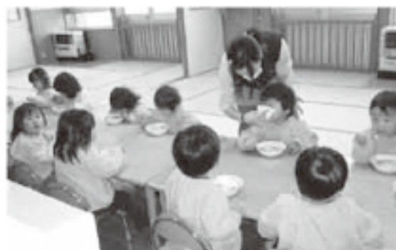
▶0歳児保育の要望が多い猪苗代保育所

千里は2クラス44名、猪苗代は4クラス71名で平成17年よりそれぞれ約20名の預かり保育を受けている。千里では発達障がい児に対する特別支援の要望があり猪苗代は施設管理上改善の必要がある。長瀬は1クラス9名の混合であり適正人数への改善が望まれる。中ノ沢保育所は定員35に31名、猪苗代は定員80に73名の入所で地域性から0歳