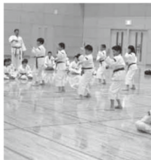
活動が定着化したカメリーナススポーツクラブ

【質問】21年度の予算編成の中で補助金の基準はどのようなものか。 【答弁】町内の有識者の方にお話しし適正な支出補助金の内容を審議し町長に答申する。 【質問】カメリーナススポーツクラブは平成16年町指導で設立したクラブで設立時150万円の補助があったが117万円まで減額している。平成18年より体育館使用料が生じ158万円と予算の約半分を支払っている。今後の運営補助をどう考えるのか。 【答弁】生涯スポーツの振興という目的の中に町