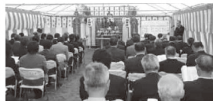
▶新町立病院建設工事起工式

で芝生・駐車場・せせらぎ公園を整備する予定である。9月の開院に向け、現在全力で取り組んでいるということであった。委員会としては、平成21年度の病院会計の負担割合は、指定管理者温知会と折半という契約上の約束がある。度重なる工事着工の遅れは、町の赤字補填が増加することを意味する。早期開院を望む町