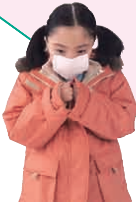
▶マスクエチケットで 周囲への思いやり

別な授業が行われていました。インフルエンザはせきやくしゃみによって飛沫感染します。くしゃみによる飛沫は秒速50メートルにもなるそうで驚きです。せきやくしゃみをする時は、マスクを付け、手ではなく肘で押さえる事が有効だそうです。肘は手に比べて他のものに触れないため、ウイルスがついても広がりにくいからです。それを勉強した子供たちが家族や近所の方たちへ伝え、地域ぐるみで予防に取り組んでいる活動は素晴らしいと思いました。 私たちの町もインフルエンザについてよく理解し、思いやりの気持ちを持ち予防に取り組んでいくことが、地域の子供たちやお年寄りを守る事につながると思います。