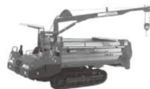
▲マニアスプレッター（堆肥散布機）

【答弁】夏の過乾燥分と冬の水分過多分を混合して水分調整できれば、ベレットが作れると考えている。