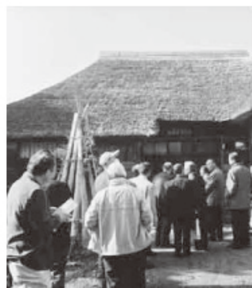
米沢市南原猪苗代町内の緑の地を研修した猪苗代地区区長会

【質問】猪苗代町の治山治水に広葉樹林が必要では。 【答弁】公益的機能の林整備を進めており、広葉樹林は天然の回復力で野生動物の生息に配慮した森林整備を推進する。 【質問】マツクイムシやカシノナガキクイムシ対策に天敵も活用しては。 【答弁】幼虫の薬剤駆除や被害木伐倒し薬剤燻蒸等を年に2回実施し早期発見に努めている。天敵利用は困難だ。 【質問】里山や自然学習などエコツーリズムを観光に活かしては。 【答弁】森林環境セミナーとして子供達に学習を