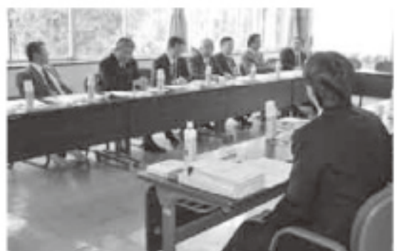
▶有意義な研修となった栃木県野木町議会

議会運営委員会は、閉会中の所管事務調査を11月6日午後1時30分より4時まで栃木県野木町議会において野木町議会の概要・議会運営や特別委員会等について調査を行いました。野木町議会の概要について、野木町は人口2万6092人で議員定数18名、常任委員会は総務文教・民生・経済建設の3委員会が各6名で構成。議会運営委員会は各委員会から2名選出による6名で構成されている。議員の1日当は廃止し政務調査費を1人につき月額1万円である。一般質問について、一般質問通告期限は定例会初日の10日前まで。発言方式は対面型1問1答方式としており、町長への反問権を付与していることから、