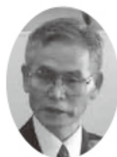
渡辺 二公 議員

の体育協会やスポーツクラブがあり最終的に一本化を図りたい。補助金の額は内容を精査して検討する。 【質問】特定健康診査の受診率と特定保健指導の内容は。 【答弁】国保の40才から74才以下、3281名の対象者について受診率は1388名の42・3%で目標の30%を上回っている。 【質問】特定保健指導の対象者は225名であり、66名の方が11月5日より6か月間保健指導を受けることになっている。