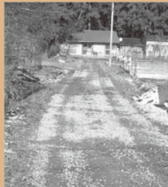
名家町道2号線の陳情箇所

○新猪苗代病院の産婦人科診療科目設置に関する陳情 (猪苗代町に産婦人科設置を求める会) 文教厚生常任委員会