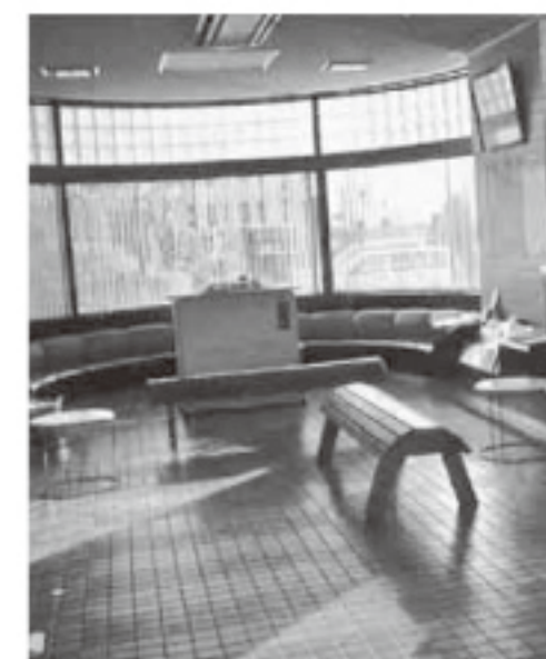
職員の喫煙が禁止された町民ホール

【質問】経常収支悪化の要因は。 【答弁】町税、臨時対策費の減少による収入減と物件費、扶助費等義務的経費の増加による。 【質問】今後の見通しは。 【答弁】固定資産税は減少するが財政健全化計画により経常収支比率は平成19年度をピークに改善の方向へ向かうと予想する。人件費、公債費の減少が見込まれる。 【質問】公債費の繰入、歳出のバランスは。 【答弁】8億円程度黒字である。 【質問】定住促進策の実施は。