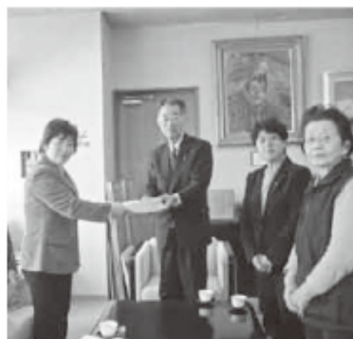
新病院に産婦人科設置を要望した町民の代表

【質問】新病院に産婦人科設置することについて、町として真剣に検討したい。 【質問】町内への産婦人科の設置を求める多くの声について伺う。 【答弁】11月20日に町民4224名の署名による陳情を受け、町民の皆様が要望されていることを重く受け止めておる。町の財政状況も十分考慮しながら検討していきたい。 【質問】全部の幼稚園に預かり保育ができないか。 【答弁】子育て支援と言う一つの大きな課題であり、重大な施策である。制度の充実発展ということで今後努めていきたい。