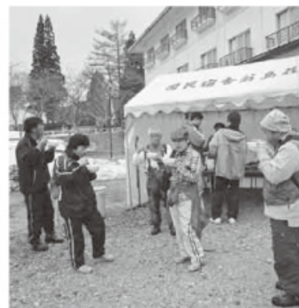
ネイチャースキーの拠点となった翁島荘

【質問】観光の現状、今後の政策について。翁島荘閉鎖について町の考えは。 【答弁】観光客の入りは前年比95%で景気低迷の影響が徐々に現れている。町には自然・文化・素材・史跡・レジャー施設もあり、これらをどのように活かすかである。翁島荘は宿泊施設として存続は難しい。自然を使った体験学習の拠点等、今後の存続について検討中。 【質問】旧役場跡地の活用は。 【答弁】今までの計画と整合性を図り、旧役場跡