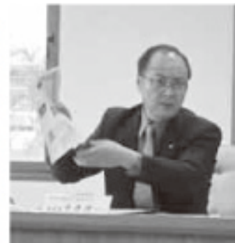
▶全国コンクール3年連続入賞している編集方法を語る 広野町広報編集委員長

11月11日双葉郡広野町議会に出張し議会広報の編集体制・編集方針を研修した。広野町議会広報「議会だより」は町議会広報全国コンクールに3年連続入賞しており、特色として、議会開催後1ヶ月で発行していること、一般質問は一人1ページ、賛成討論と反対討論の票数、内容等を詳しく掲載、追跡レポート「あの質問はどうなった」又「ましかどインタビュー」は広報委員がひとつ問題に対し様々な意見を直接町民にインタビュー方式で意見・感想を掲載している。どの項目をとっても、卓越しており、大変参考になった。 11月12日は、県町村議会議長会主催の広報委員会の研修はビックパレットで開催された。「議会だより」編集のポイントの基調講演があり、編集会議のあり方、編集作業、入稿、校正、献本等の内容であった。その後、県内5議会の広報を使っているクリニックスがあり具体的に改善策等のアドバイスがあった。 議会広報は、公平性、正確性、客観性を保ち、分かりやすい文章で、見やすく読めるだけ早く発行すること、最大限の努力すること、を再確認しました。 来年度発行の「議会だより」からこの研修の成果を生かし改善していきたいと思えます。