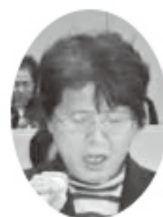
五十嵐 ミエ子 議員