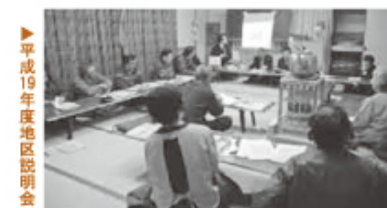
平成19年度地区説明会

【質問】平成21年度の予算編成基本方針は。 【答弁】収入体制強化、事業の見直し、経常経費75%以上を削減する。 【質問】昨年歳入を増やす方法に提案した公用車を軽自動車にすることは。 【答弁】町として具体的に出来ない、対応しなかった。 【質問】町営住宅跡地の住宅分譲は、人口の増、住民税・固定資産税の増加、地元業者を利用すること等知恵を出して安く分譲すれば、地域活性化につながるかと昨年も提案しましたが。 【答弁】努力はしましたが、努力を超えた経済環境の影響があった。 【質問】事業の見直し、優先順位はどのように。 【答弁】事業の重要性、緊急性、福祉の向上が図られるものを基準にする。 【質問】町民バスはどのように。 【答弁】交通体系の見直し、検討する。