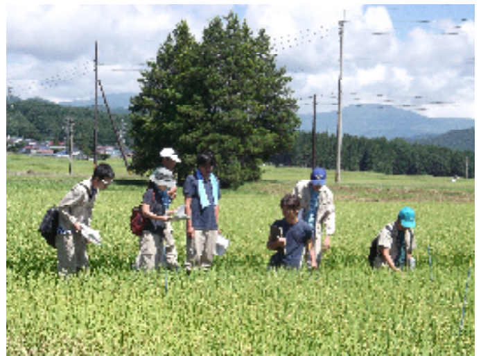
水稻品種を観察する農業総合センター職員

※立毛検討会：水稻の品種を評価するうえでは、「イネの姿」が重要な評価ポイントになります。ほ場で生育中のイネを観察しながら、「イネの姿」を評価する観察会が「立毛検討会」です。