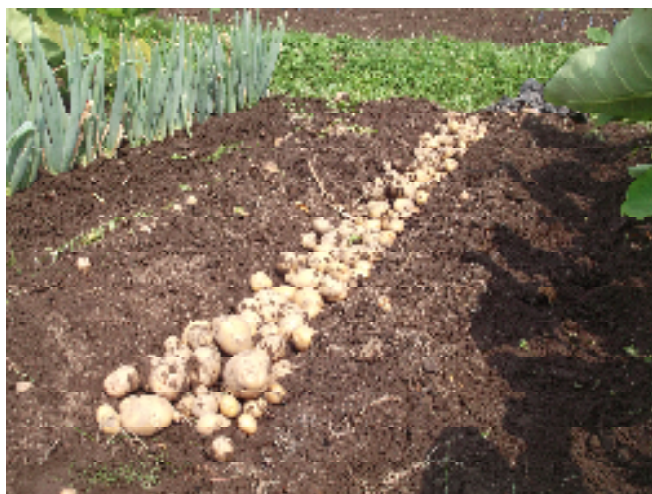
掘り起こされたジャガイモ

今回は、ジャガイモの収穫とサトイモ、ネギの追肥・土寄せ作業を行いました。サトイモは、追肥・土寄せの効果で大きく成長しています。ネギは長雨の影響で黒斑病が発生しましたが、収量には影響なさそうです。