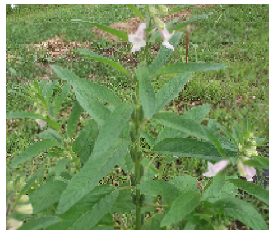
「アグリいな」で栽培中の黒ゴマ