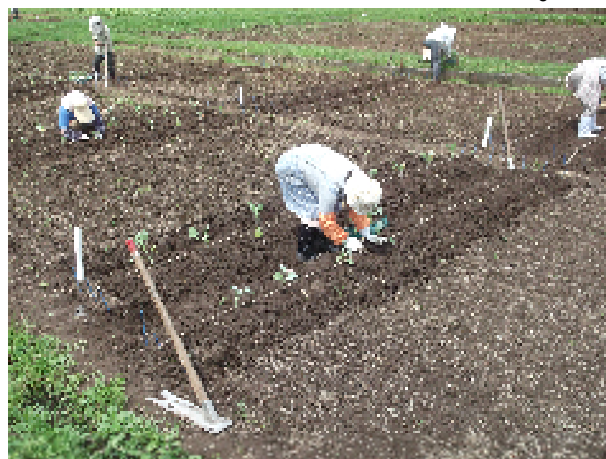
カリフラワー、ブロッコリーの定植