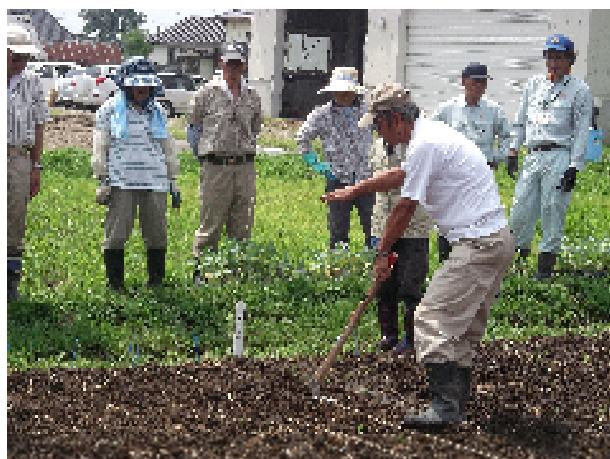
熱心に講師の話を聞く受講者

今回の作業はカリフラワー、ブロッコリーの定植とハクサイのポット播種です。受講者は熱心に講師の話を聞き、丁寧に作業をしていました。皆さんが収穫を楽しみにしているようでした。