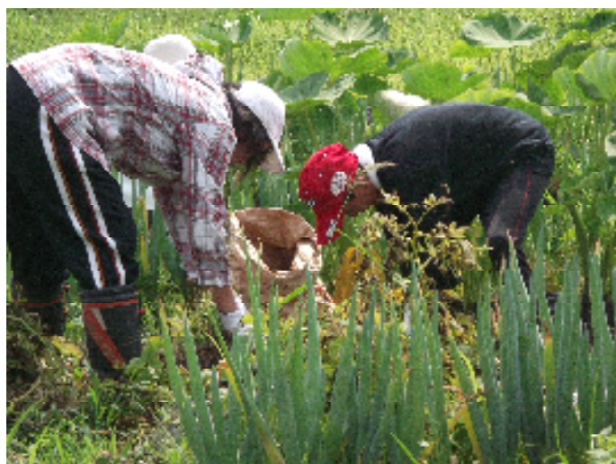
ジャガイモの収穫

参加者は、土の中からジャガイモを丁寧に掘り出し、大きく育ったジャガイモを手に取りながら収穫の喜びを味わっていました。今年のジャガイモは出芽から順調に生長し、面積の割には多くの収穫を得ることができました。ただ長雨の影響もあり、場所によっては腐敗芋が多く発生しました。また、割れ芋が多いのも今年の特徴でした。