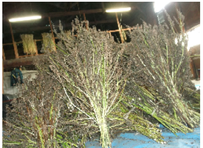
収穫したエゴマを乾燥