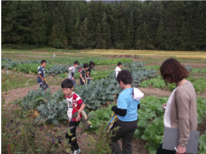
ブロッコリーを観察する子供たち