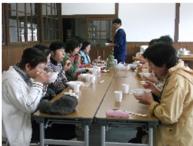
講習会終了後に収穫祭