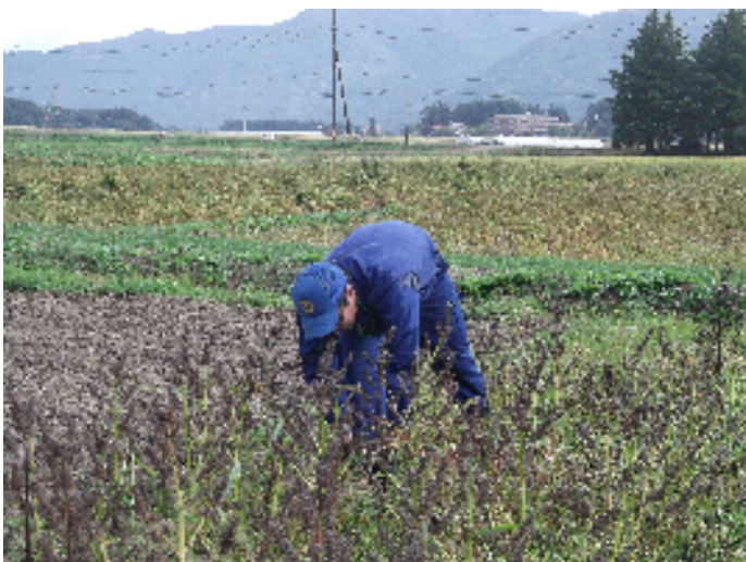
エゴマの収穫作業

エゴマは \alpha -リノレン酸を含む健康増進作物ですので、猪苗代町でも栽培面積が広がることが期待されます。