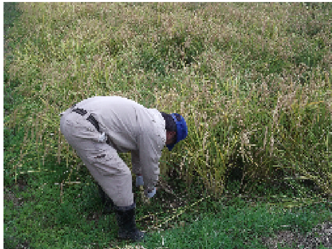
稲刈り鎌による収穫