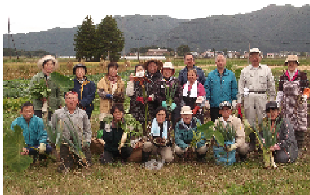
収穫物を手に記念撮影

参加者の皆さんは、『施肥について』の講義の後、前期の講習会はサトイモとネギの収穫、後期の講習会はブロッコリーとダイコンの収穫作業を行いました。