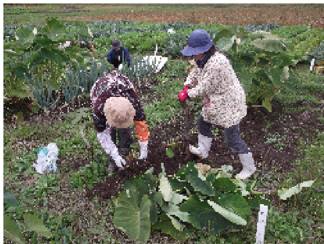
サトイモの収穫作業

来年は、参加者の皆さんから頂いたご意見などを参考に、より良い講習会にしたいと考えています。