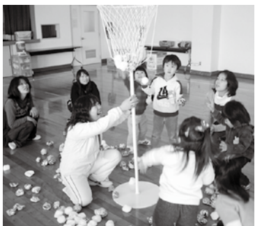
ちびっこランドの活動の様子