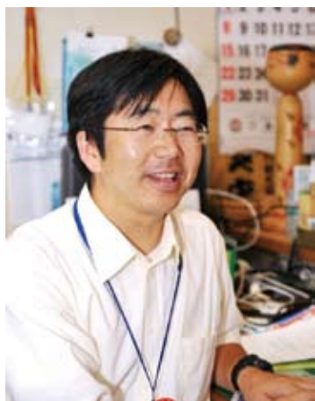
（社）猪苗代観光協会 主査