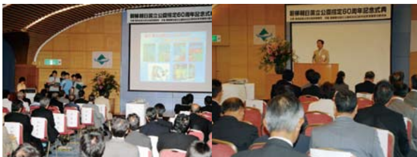
磐梯朝日国立公園指定 60 周年記念式典の様子（裏磐梯猫魔ホテル）