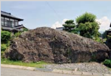
国指定天然記念物

押し寄せた岩屑なだれが、長坂地区を襲った。地区内では、朝から田畑に出かけ、農作業をしていた人々が被害に巻き込まれた。このなだれで、長坂地区の住民の半数以上の命が失われた。櫛ヶ峰と赤埴山の間では、岩屑なだれとともに爆風(火山灰や小石を含んだ、恐ろしい破壊力がある風)が吹き荒れ、見称地区や渋谷地区を襲った。渋谷地区では、土砂ではなく、爆風で家が倒壊する被害が多かった。長坂地区から直線で2キロ程度しか離れていないにもかかわらず、災害の種類が違ったため、犠牲者は少なかったと報告されている。町内の犠牲者は、合わせて178人に及んだ。