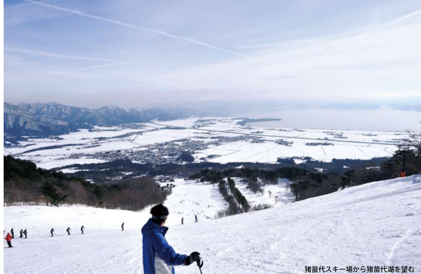
猪苗代スキー場から猪苗代湖を望む

磐梯朝日国立公園への指定は、登山、スキーや避暑に訪れる観光客を増加させ、磐梯山周辺エリア全体の発展に大きな貢献を果たした。本年は、磐梯朝日国立公園指定から60年を迎えた記念の年。裏磐梯の裏磐梯猫魔ホテルでは6月20日、記念式典が催され、関