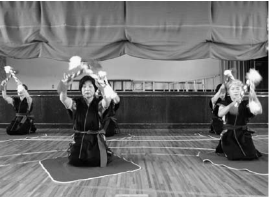
猪苗代音頭に合わせて息のあった演奏を見せる会員ら