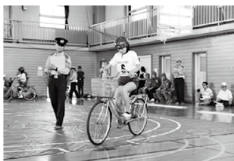
写真上 技能走行テスト1番の難所、ジグザグ走行に挑む翁島小の児童 写真下 8の字走行をする長瀬小の児童。両校とも会津方部大会で上位入賞し、安全運転技術の高さを証明しました