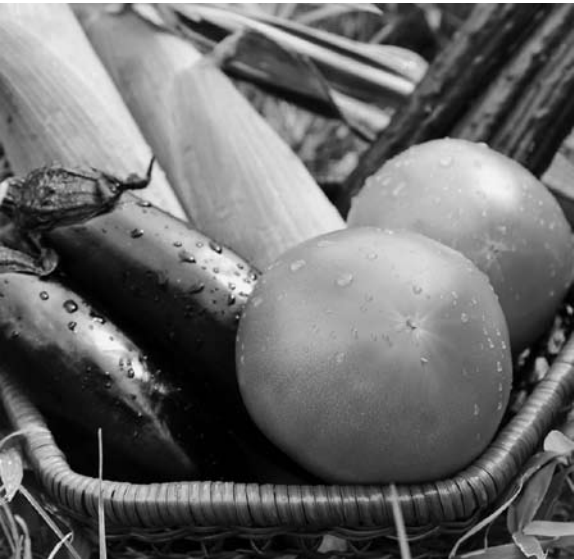
おいしそうな夏の野菜。冷たいものはほどほどに。たくさん食べたい時は、一手間加えて食べましょう。

とで生食よりも体を冷やしません。 例えば、ナスはマリーナスや焼きナスに、トマトはスパゲティやトマト煮に、きゅうりは味噌汁などにしてみてはいかがでしょう。また、根菜類、ねぎ、みょうが、しょうがなどのからだを温めてくれる野菜と組み合わせてバランス良く食べましょう。 夏バテ気味で食欲がない時も、そうめんや冷