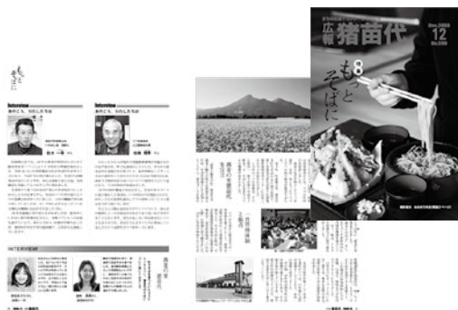
入賞した12月号の表紙(右)と記事

先月号の編集後記で少しお知らせしましたが、日本広報協会主催の全国広報コンクール広報紙(町村部)部門で、「広報猪苗代2009年12月号」が入選しました。この号の特集は「そばでのまちづくり」の歩みを振り返ったものでした。