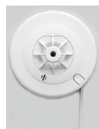
写真は 住宅用火災警報器

個人事業税は、県内に事務所・事業所を設けて、物品販売業や不動産貸付業など、一定の事業を営んでいる人に納めてもらう県の税金です。会津地方振興局