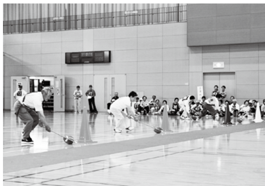
各地区を代表して「豚追い競走」に挑む参加者ら

町高齢者スポーツ大会は6月11日、カメリーナで開催されました。町と町老人クラブ連合会が主催するこの大会には、町内6地区から約300人が出場、各地区の参加者から仲間に対する声援が上がり、カメリーナ中に響き渡りました。