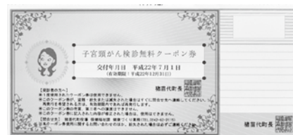
がん検診無料クーポン