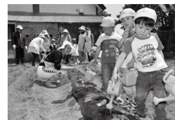
写真上 「斜めに植えるんだよ」「斜め…こう？」食改さんも身ぶり手ぶりで子どもたちに説明します 写真下 「はやくおおきくなあれ」と園児たちはおまじないを唱えます