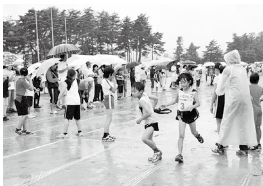
激しい雨の中、リレーマラソンに挑む選手ら

22年度町民マラソン大会は6月27日、町運動公園で開催され、小・中学生を中心に約500人が、23クラスで健脚を競いました。レースは、あいにくの雨模様となりましたが、参加者たちは力強い足取りでコースを駆け抜けました。