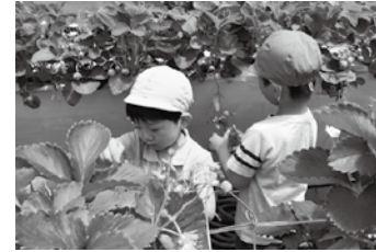
写真上 イチゴ狩りを楽しむ園児たち。「なんでおじさんが食べてんだよ～」と笑顔 写真下 真っ赤に実った大粒のイチゴを選び、袋に入れる園児たち。お土産は家族に喜ばれたかな