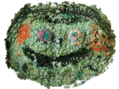
ちぎったロールペーパーに水と洗濯のりを加えた、手作りパルプ粘土です

みんなが自分の役割を果たして、ニコッとした笑顔を作りました。ケーキを作る予定でしたが、粘土の感触を楽しんでいるうちに人の顔になりました。