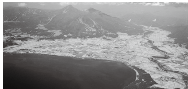
美しい猪苗代湖の水環境をみんなで守りましょう

本年度から下水道に接続可能となつてからの経過年数区分を廃止しました。今後は融資あっせんを利用した全ての借り入れで、利子相当額の全額を助成することになりました。