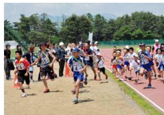
勢いよくスタートするリレーマラソンの参加者

25年度の町民健康マラソン大会は6月30日、町民運動公園で開かれ、参加者らが健脚を競いました。