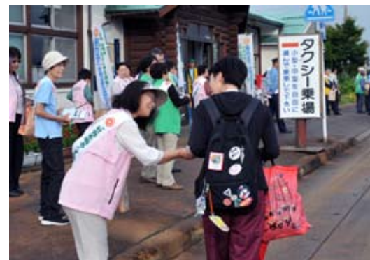
J R猪苗代駅前啓発グッズを配る参加者

「社会を明るくする運動」強調月間の7月、町内では猪苗代地区の保護司会や更正保護女性会などの関係団体により、犯罪のない明るい社会を築くための活動が繰り広げられました。