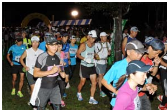
早朝5時、100㌔、65㌔コースのスタート

第8回磐梯高原猪苗代湖マラソンは9月7日、ホテルリステル猪苗代をスタート・ゴールとし、猪苗代湖周辺を走る3コースで開催されました。猪苗代湖を1周半回る100㌔、1周する65㌔、郡山市の舟津公園で折り返す42.195㌔、同公園からリステルまでの21.0975㌔の4コースに合わせて約1800人が参加。磐梯山や猪苗代湖の景色を眺めながら、日頃のトレーニングや健康づくりなどで鍛えた自慢の健脚を競いました。