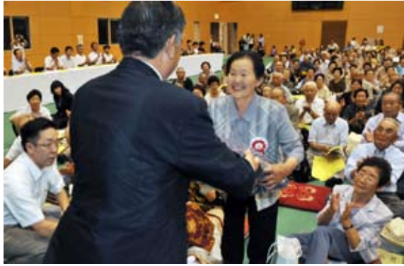
85歳を迎えた人の代表者に、座布団が手渡されました