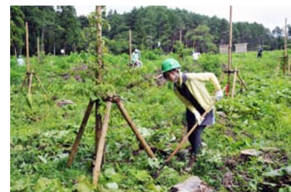
桜の生長を願って下草を刈る参加者