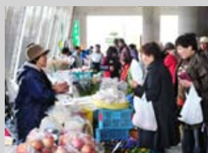
昨年の出店者の様子(屋内、屋外ブース)