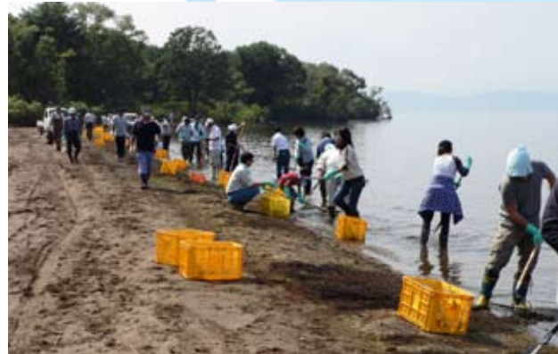
初日の活動の様子。昨年は延べ約1700人が参加しました