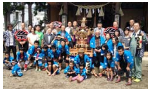
八千代区自治会に整備された子どもみこし

このたび、財団法人自治総合センターの宝くじ普及広報事業費を活用した、平成25年度コミュニティ助成事業により千貫地区に太鼓やテントなど、八千代区自治会に子どもみこしが整備されました。