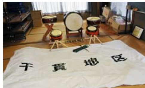
千貫地区に整備された太鼓やテントなど