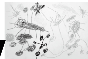
写真上 表彰状を手に、緊張気味の聖也くん。上手に書けたねと話しかけると「うん」と笑ってくれました 写真下 虫たちの姿を書いた聖也くんの作品。カラーで見せできないのが残念