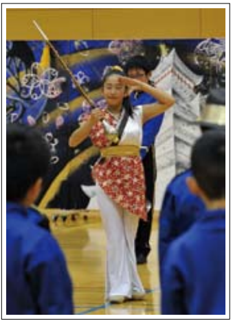
【撮影日】 11月22日 【撮影場所】 カメリーナ

まちの応援マガジン いなわしろ 広報猪苗代 Dec.2013 12 No.638