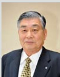
町長 公 前後

町民の皆さんには、各種イベントに多くのご支援、ご協力をいただき、深く感謝申し上げます。 お蔭様をもちまして、東京電力福島第一原発事故による風評被害で激減した観光客も震災前の水準まで戻りつつあります。 現在は、「風評被害」というマイナスのイメージから脱却して、攻めの観光振興を行うべく、さまざまな事業を展開しているところです。 本町ではこれから本格的なスキーシーズンを迎え、来年2月には全国高等学校総合体育大会ス