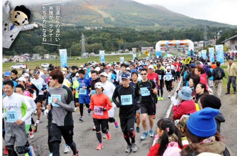
スタートの様子。スタート・ゴール地点以外の場所でも多くの町民が選手らに温かい声援を送った