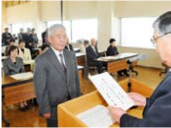
▲前後町長から各地区の代表者に委嘱状が手渡されました。