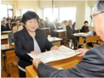
▲町民の皆さんのため長年活躍した功績に対し、前後町長から感謝状が贈られました。