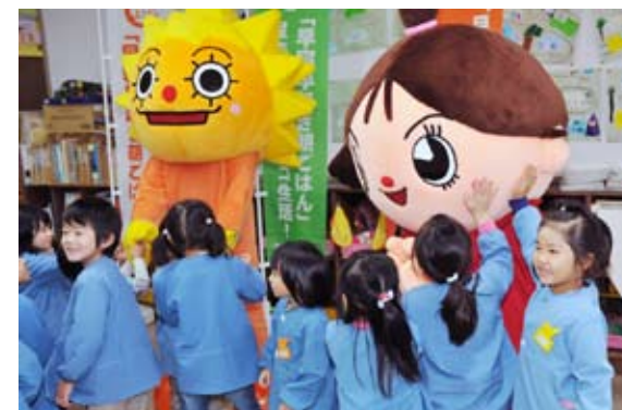
キャラクターの登場に大喜びの翁島幼稚園の園児たち

国立磐梯青少年交流の家は11月25日～12月3日、「早寝早起朝ごはん」の啓発活動のため翁島、猪苗代、千里の3幼稚園を訪問しました。「はやねちゃん」「はやおきくん」「よふかしおに」など「早寝早起朝ごはん」国民運動のキャラクターと共に訪れ、紙芝居や体操などを通して、規則正しい生活の大切さを園児たちに伝えました。園児たちは、かわいいキャラクターの登場に大喜び。一目散に駆け寄って、握手をしたり、触ったりしていました。