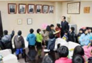
右_職員の説明の内容をメモしたり、質問したりして仕事の内容をしっかりと学びました。中_気分はすっかり町長。みんなともうれしそうでした。左_町長室を見回す児童たち