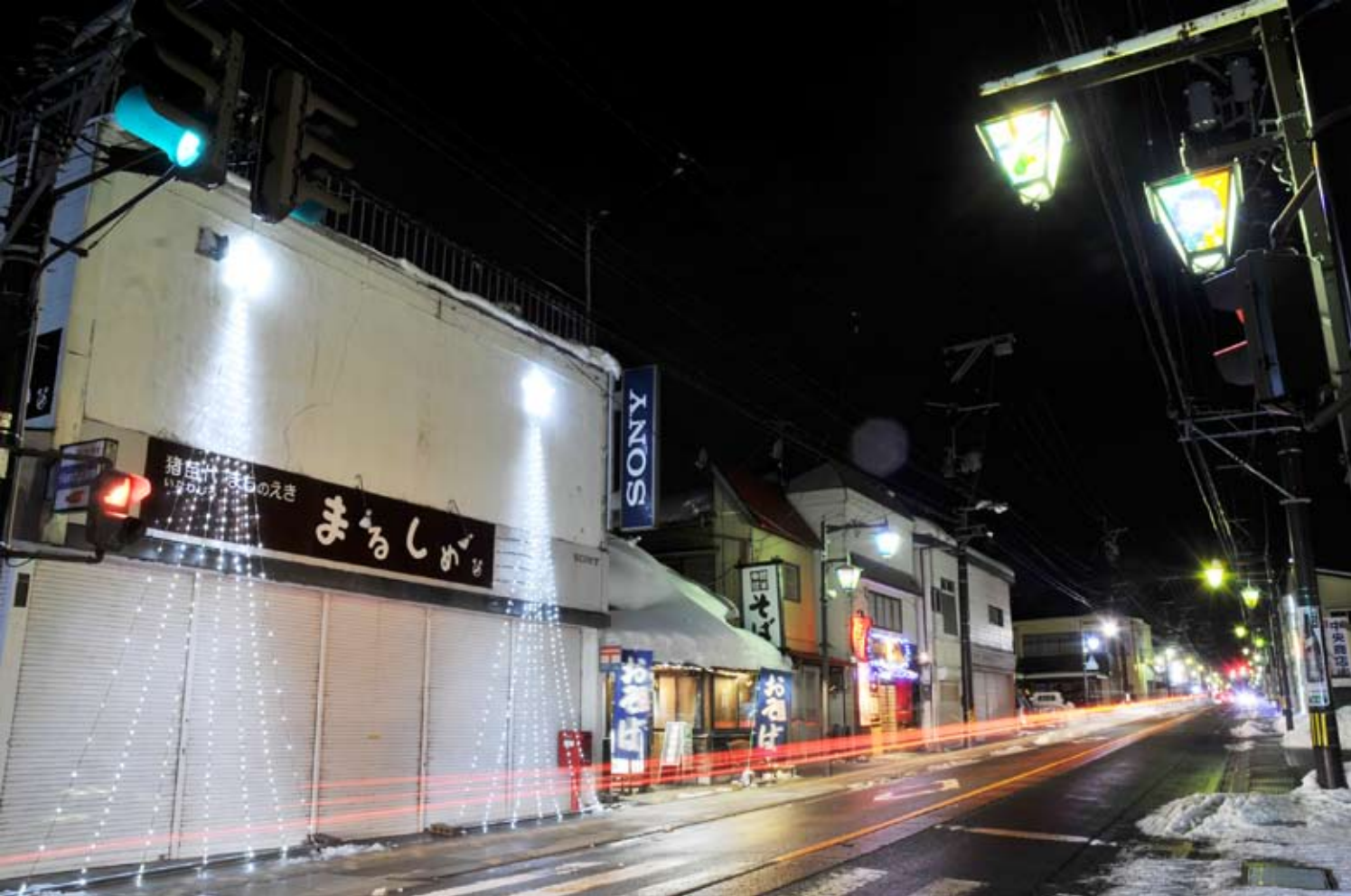
上_まちのえき「まろしめ」前/左_中央商店街駐車場 中_幻想的な光を放つステンドグラス/右_点灯式でイルミネーションのスイッチを押す関係者