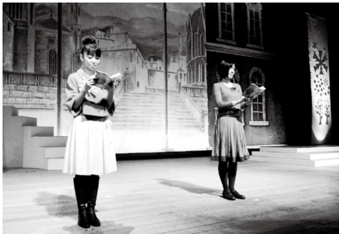
本を声で聞くことで、より深く情景を感じられます