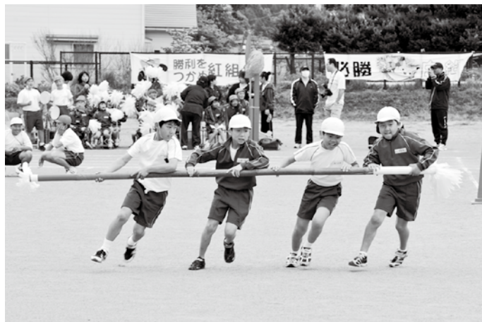
今年も吾妻小の運動会には台風が吹き荒れた