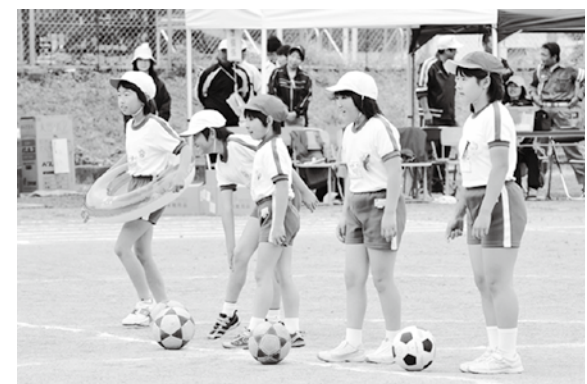
先生お願い！ これを選んでね(翁島小)