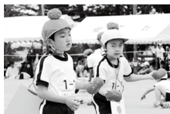
落とさないように慎重に・・・