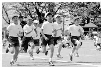
学年No.1決定戦 長瀬小(左)と猪苗代小(右)の徒競走