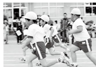
今年入学の1年生も頑張ります

猪苗代・翁島・千里・月輪の4校も30日に運動会を迎えました。全校を回りましたが、各校とも校庭から聞こえてくる歓声がとても楽しそうでした。