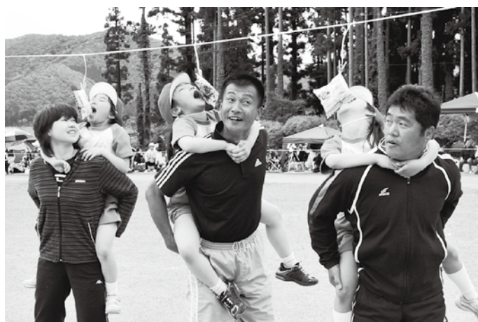
お父さん、早く早く！ 緑小の親子パン食い競争