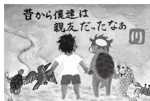
「河川愛護月間」絵紙コンクール 受賞作品

国土交通省では、昭和 49 年から毎年 7 月を「河川愛護月間」と定め、河川愛護運動を実施しています。