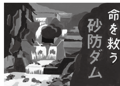
土砂災害防止に関する絵画コンクール 受賞作品